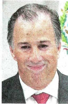
José Antonio Meade