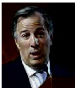
JOSÉ ANTONIO MEADE