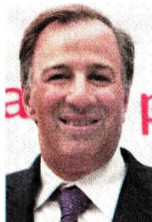
José Antonio Meade