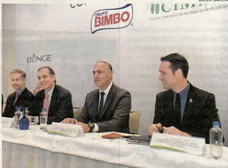
Producir más con menos y con mejores insumos, la meta de Servitje.

El heredero del fallecido Lorenzo Servitje, fundador de Bimbo, añadió que el plan de trigo, firmado con Bunge México y Cimmyt, tendrá