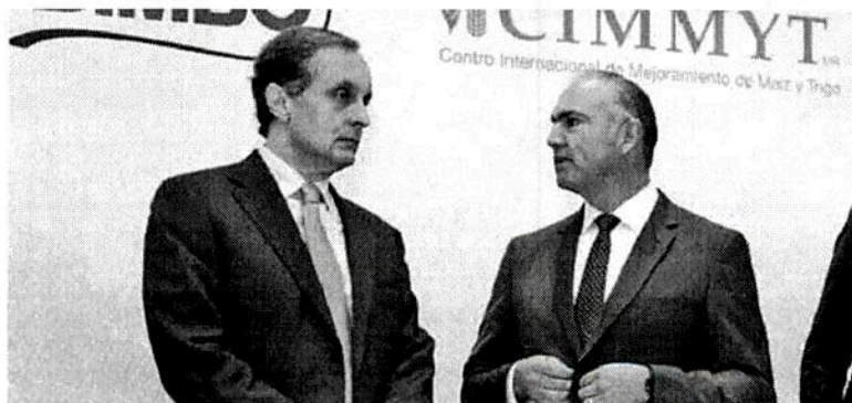
Calzada señaló que hay 22 millones de hectáreas sembradas en el país

del presupuesto 2018 de la dependencia se destinará a pequeños productores