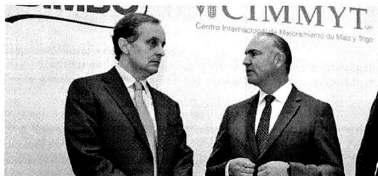
Calzada señaló que hay 22 millones de hectáreas sembradas en el país.

del presupuesto 2018 de la dependencia se destinará a pequeños productores