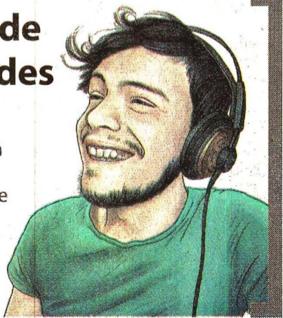
ILUSTRACIÓN: ELIHU GALAVIZ