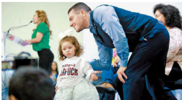
Omar García Harfuch busca gobernar CdMx. JUAN CARLOS BAUTISTA

La elección de 2024 será diferente en muchos sentidos. Debe preocupar que grupos al margen de la ley pretendan imponer o vetar candidatos. Por eso es importante el imperio de la ley. Pero igual de preocupante resulta el riesgo que la polarización y el maximalismo que mueven a las fuerzas políticas en contienda, así como el desprecio a la ley generen condiciones para que la competencia cobre un curso al margen de la civilidad política y de los cauces institucionales. El país necesita de la madurez y sentido de responsabilidad de todos: autoridades, partidos, candidatos y sociedad organizada. ■