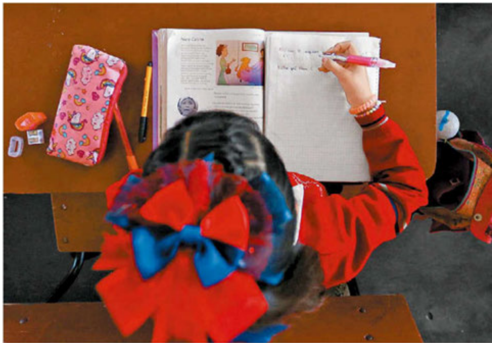
Tarda uno en inteligirse, peor aún si le faltan las herramientas. ESPECIAL