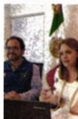
Clara Luz Flores Carrales