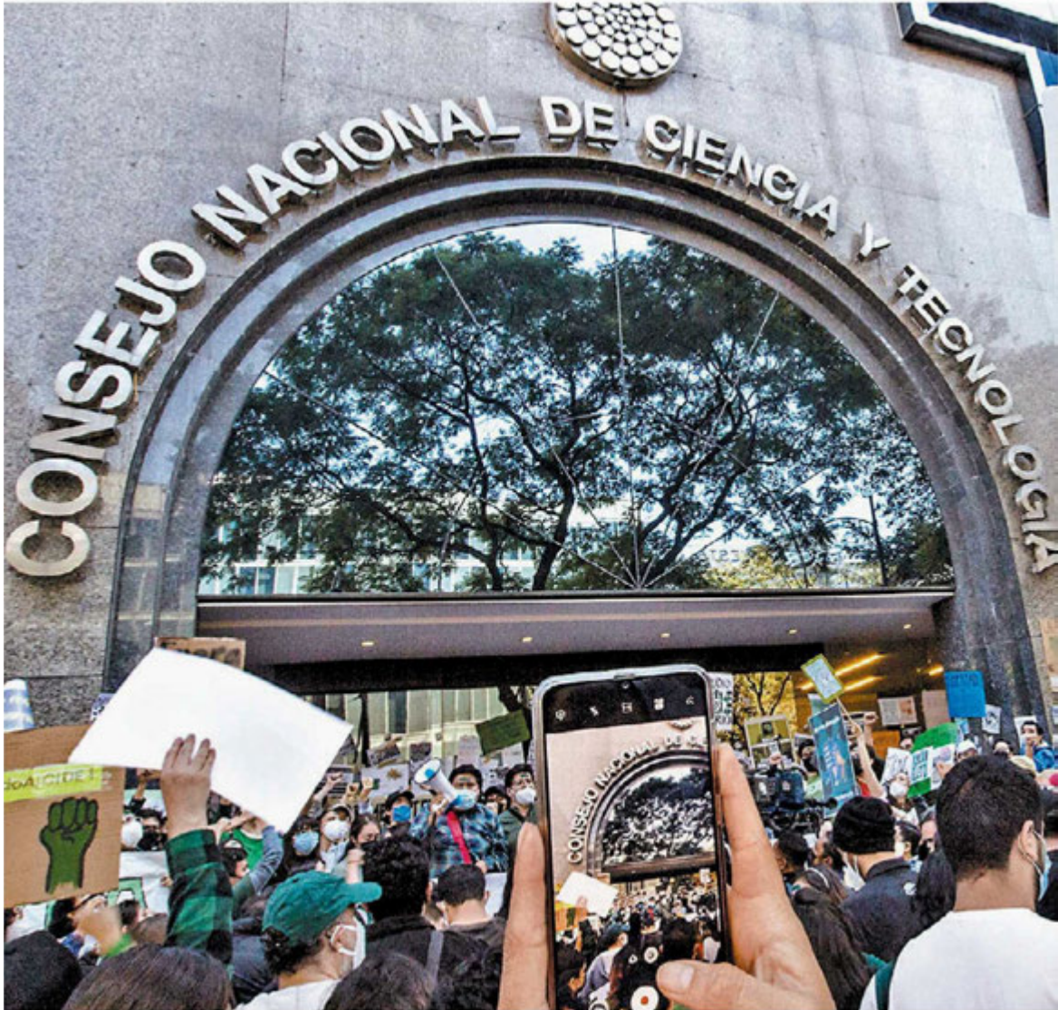
En 2022 redujo 75% el apoyo a estudiantes, respecto de 2015. JESÚS QUINTANAR