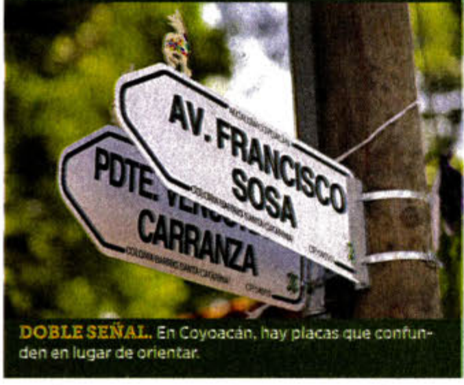
DOBLE SEÑAL. En Coyoacán, hay placas que confunden en lugar de orientar.

El propósito de las comisiones es homologar esos letreros en todas las calles de la Capital.