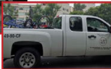
Usan camioneta de la Comisión de Derechos Humanos de la CDMX para acarrear los triciclos.

Luego del decomiso de triciclos a vendedores ambulantes de alimentos (y de la discusión pública sobre el trato que recibieron estas personas), este sábado se realizó una curiosa manifestación contra la criminalización de esta actividad... sólo que los bicicleteros no se veían muy vulnerables y recibieron una ayuda indebida