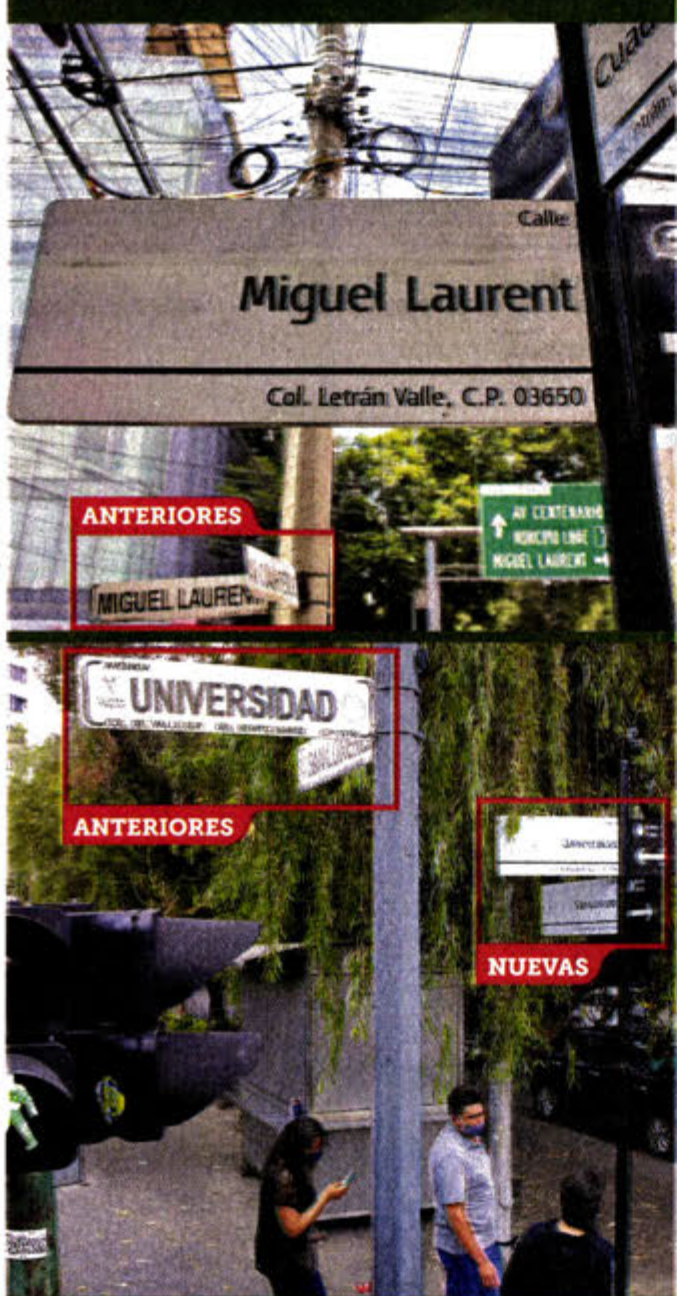
INNecesario. En la Benito Juárez es común observar en varios cruces señalizaciones nuevas y antiguas.

MALGASTAN Expertos critican que se destinaron millones de pesos para placas nuevas y ahora se duplican en varias esquinas de las Alcaldías.