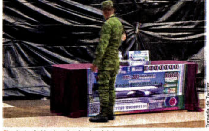
La Lotería Nacional colocó módulos para vender boletos en instalaciones militares del Valle de México.

El viernes, el Gobernador de Tabasco, Adán Augusto López, aseguró que había invertido 100 mil pesos en boletos.