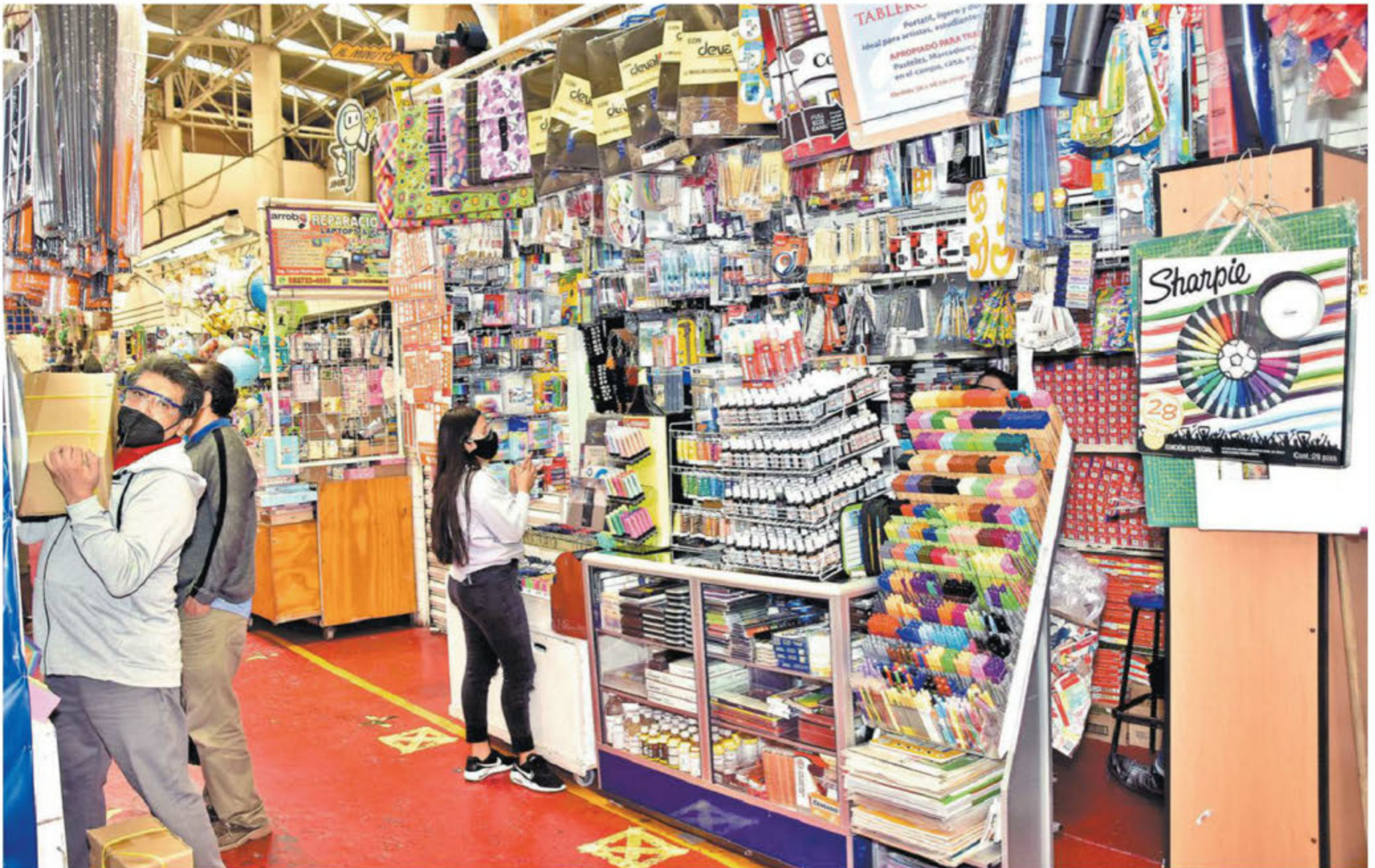
Las familias no están comprando listas de útiles completas; solo adquieren lo más básico, como cuadernos y plumas

A UNA SEMANA DEL CICLO ESCOLAR VIRTUAL, PAPELERÍAS APENAS TIENEN VENTAS DEL 35% Pág. 5