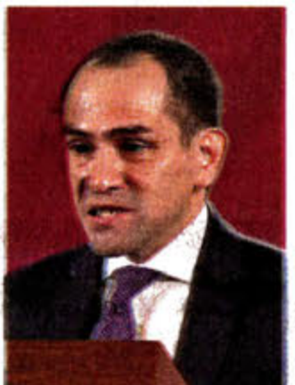
Arturo Herrera se reunió con diputados de Morena.

Herrera reconoció que el efecto económico por la epidemia de Covid 19 fue "brutal" y se espera que cierre el año con una caída del PIB en promedio del 74 por ciento.