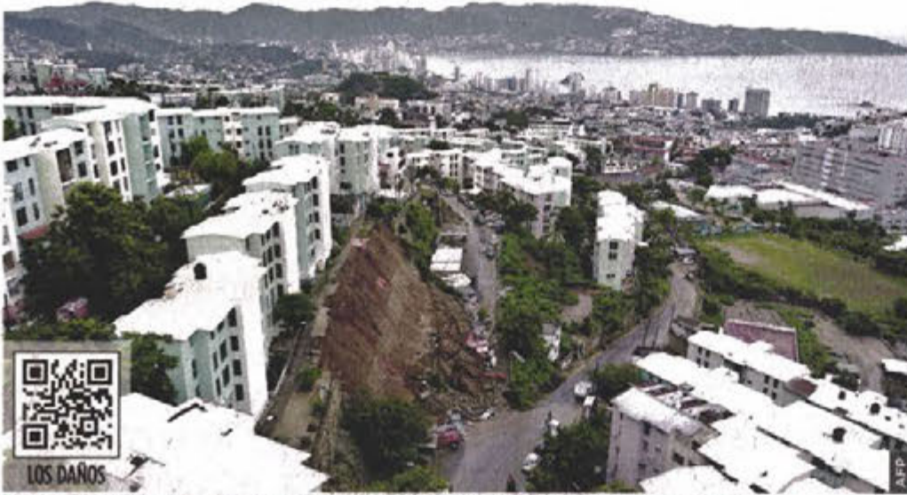
Edificios en Acapulco han quedado en riesgo de colapso, a causa de los deslaves.