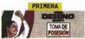
PRIMERA DESTINO TOMA DE POSESIÓN