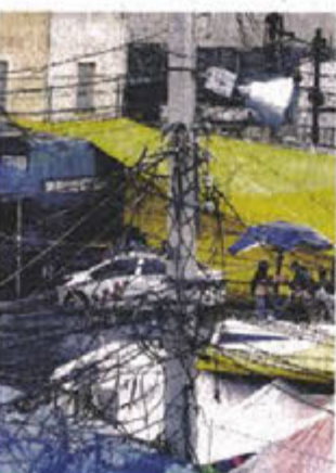
"Diablitos" en el mercado Sonora, de la CDMX

También se informó que desde dicho año y hasta 2022 se destinarían unos 700 millones de pesos para abatir este delito, cometido en al menos 10