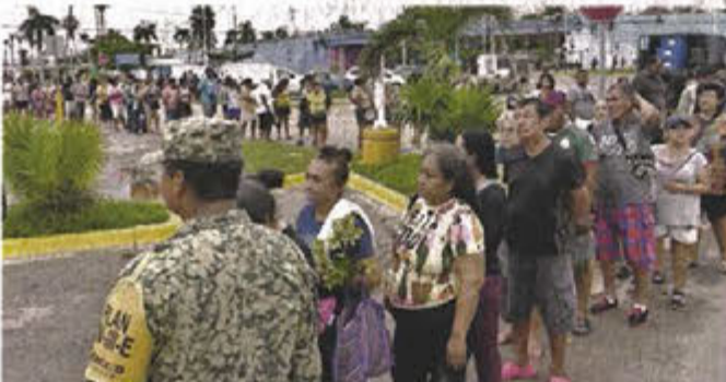
Cientos de personas hicieron fila para recibir ayuda, tras el paso del huracán "John", en Acapulco.

la Marina y Protección Civil municipal continuaba con las labores de rescate con lanchas y motos acuáticas.