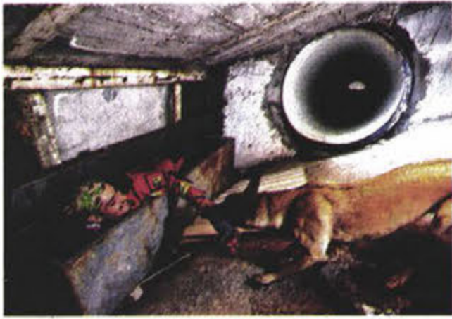
Cada sábado, Ombra es entrenada en el simulador ubicado en Ciudad Universitaria, que tiene 50 metros de túneles.