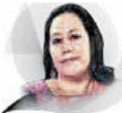
María Luisa Albores