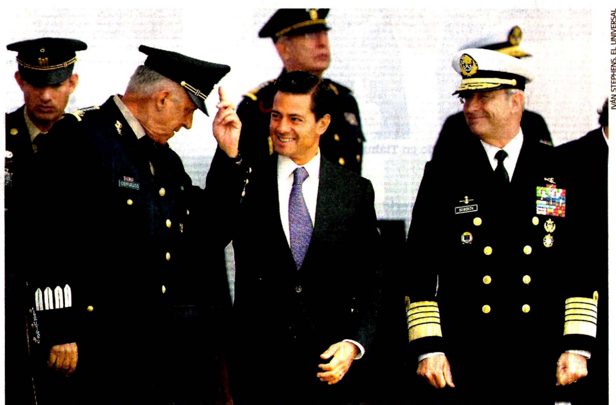
Durante la entrega de reconocimientos a las Fuerzas Armadas, el general Salvador Cienfuegos, secretario de la Defensa, muestra al presidente Enrique Peña Nieto sus insignias; al lado, el almirante Vidal Francisco Soberón, secretario de Marina.