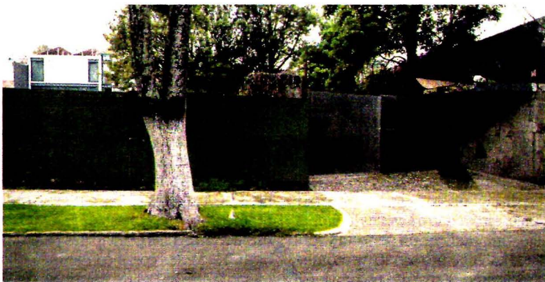
El predio está ubicado en Sierra Fria 725, colonia Lomas de Chapultepec, en la Ciudad de México. El terreno fue adquirido el 12 de mayo de 2011.