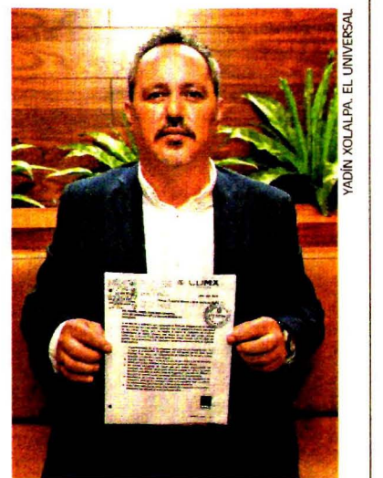
El delegado muestra uno de los documentos que entregó a Mancera.