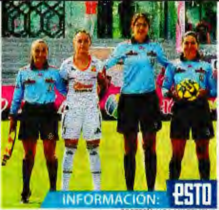
INFORMACIÓN: ESTO CORTESÍA LIGA MX FEMENIL

Arranca la Liga Femenil de fútbol profesional; los equipos forman parte de los clubes de la Liga MX