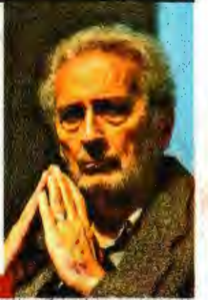
MARÍA JOSÉ MARTÍNEZ / CUARTOSCURO

El artista plástico habla sobre el "antimural" que realizó para el Cenart