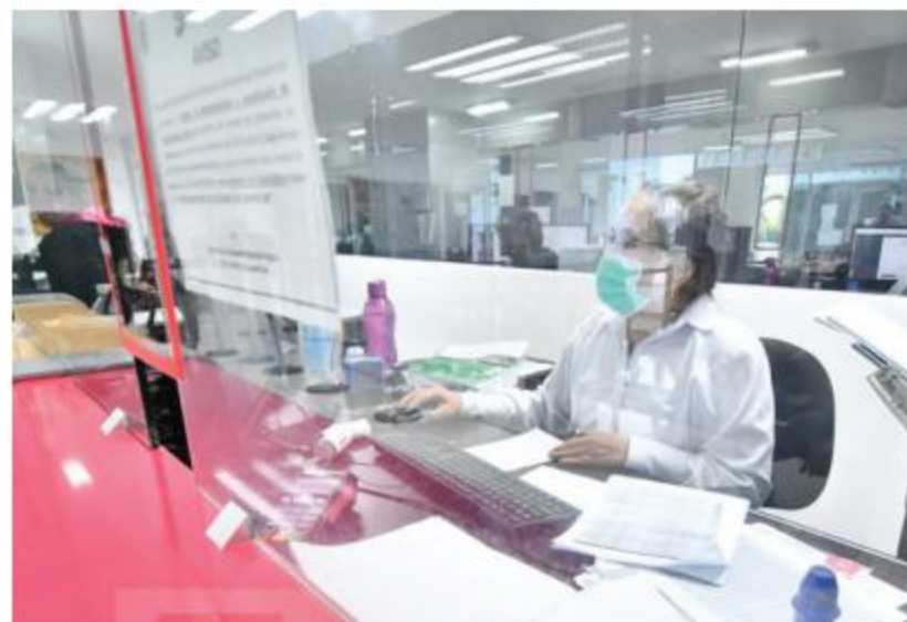
CDMX. Este lunes reactiva el gobierno capitalino la atención presencial.

blicas de la Administración Pública y Alcaldías de la Ciudad de México, que recibieron las dosis correspondientes de la vacuna contra el virus Sars-Cov-2 (COVID-19), o bien, que conforme al calendario de vacunación hayan tenido derecho a recibirla, regresarán a laborar de manera presencial a sus oficinas”, se expone en la Gaceta Oficial de la Ciudad de México . PAG 10