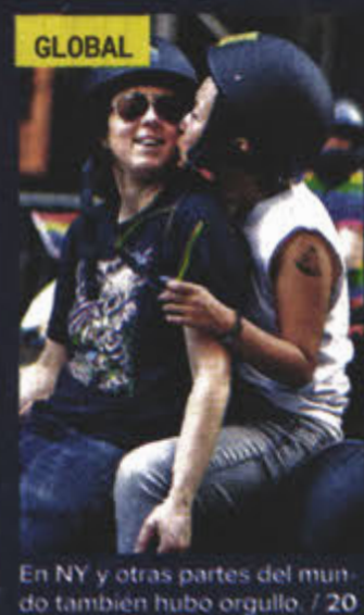
En NY y otras partes del mundo también hubo orgullo. / 20