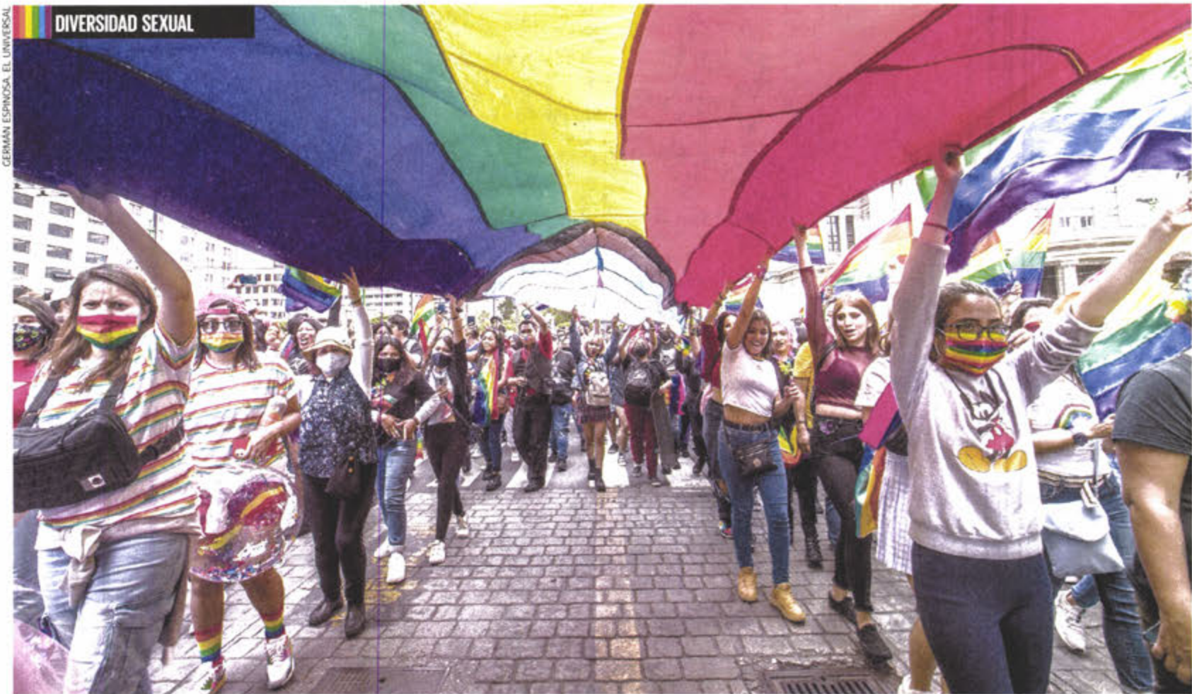
GERMÁN ESPINOSA. EL UNIVERSAL