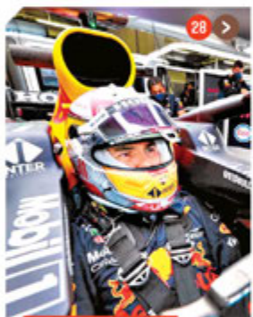
FÓRMULA 1 28 >

AL LÍMITE. ITALIA SUFRIÓ DE MÁS ANTE AUSTRIA PARA AVANZAR A LOS CUARTOS DE FINAL