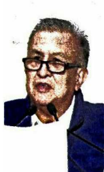
Saúl Huerta Corona

:::: Nos adelantan que la próxima semana habrá definición de la Sección Instructora de la Cámara de Diputados sobre la solicitud de desahucio del exdiputado de Morena, Saúl Huerta Corona acusado de abuso