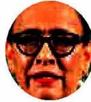
Rosa Icela Rodríguez

Tras el éxito de vacunación a todos los mayores de 18 años en Baja California, el gobierno federal se fijó una nueva meta: Sonora será el siguiente en inocular totalmente a sus mayores de edad. La secretaria de Seguridad, Rosa Icela Rodríguez, quien coordina esa campaña, informó que se trasladaron 85 mil dosis de Janssen, de una sola aplicación, para los sonorenses.