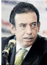
Humberto Moreira Valdés