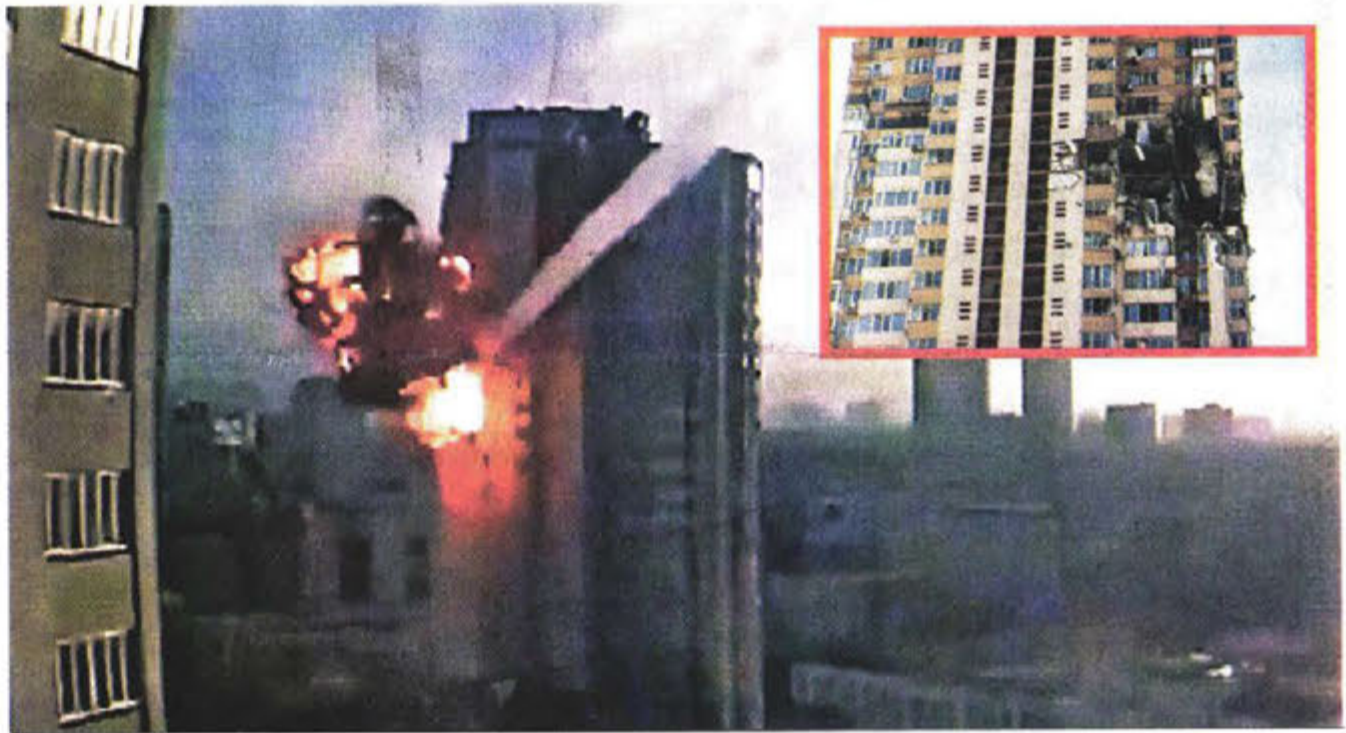
LOS DAÑOS COLATERALES Las tropas rusas continuaron sus ataques a civiles. Una cámara de seguridad captó el momento en que un misil impacta un edificio de departamentos en Kiev; se desconoce si hubo víctimas.