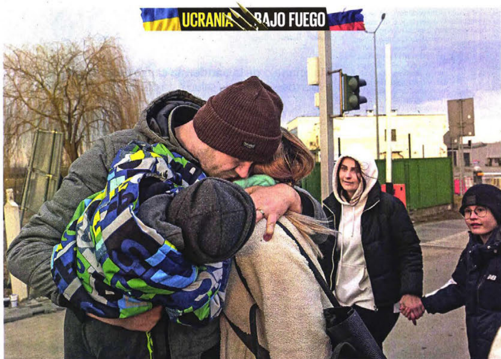
Una familia ucraniana se reúne tras llegar al cruce fronterizo de Medyka, en Polonia. Los hombres ucranianos se quedan, ante la orden de pelear.