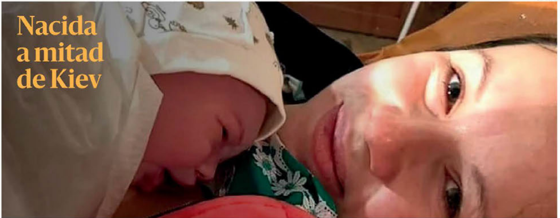
La pequeña nació en un espacio destinado a refugiados, a mitad de Kiev, durante las horas previas a la segunda embestida rusa.