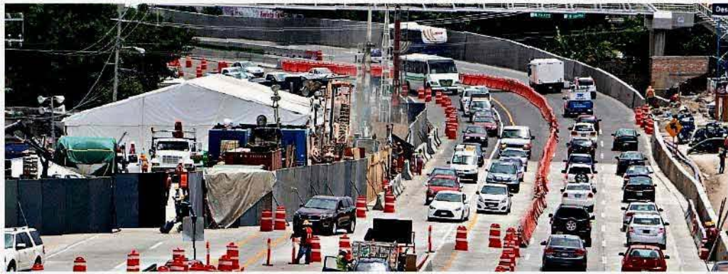
Ayer se hacían trabajos de reforzamiento y reparación de la zona afectada en el Paso Expres.

En un oficio dirigido a Francisco Javier Bermúdez, titular de la DGPC, el funcionario federal señala que su actuación debió haberse dado incluso antes de que se registrara el evento, ocurrido el 12 de julio, pues personas