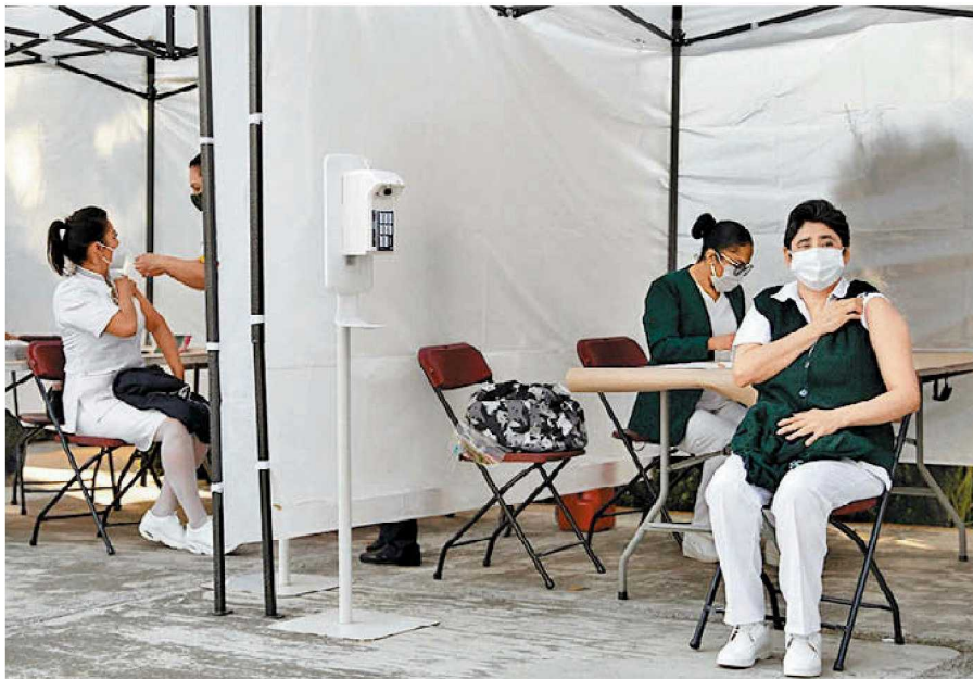
Personal médico recibe la vacuna Pfizer en CdMx.