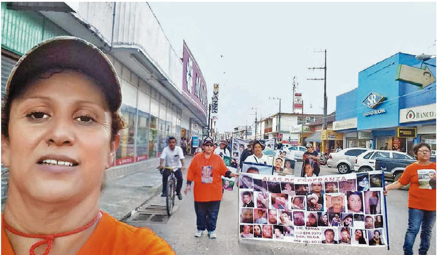
Una de las manifestaciones que encabezó la mamá de la mujer desaparecida hace nueve años.