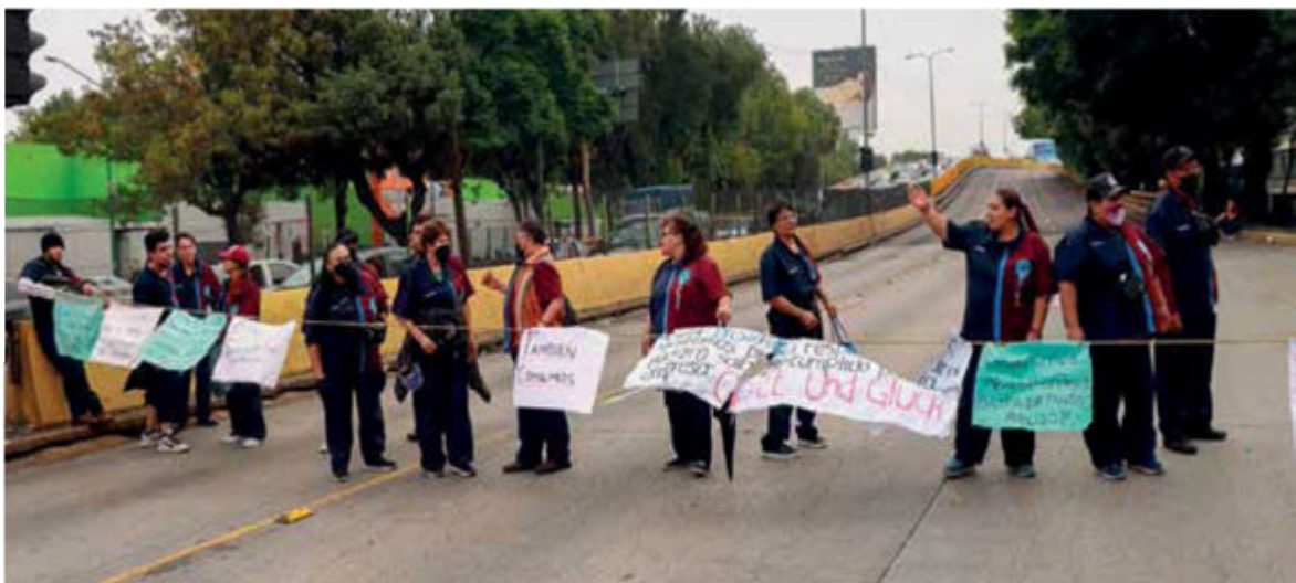
Las irregularidades y la falta de cumplimiento de las obligaciones laborales han llevado a una situación insostenible a los trabajadores del IPN por no tener IMSS.