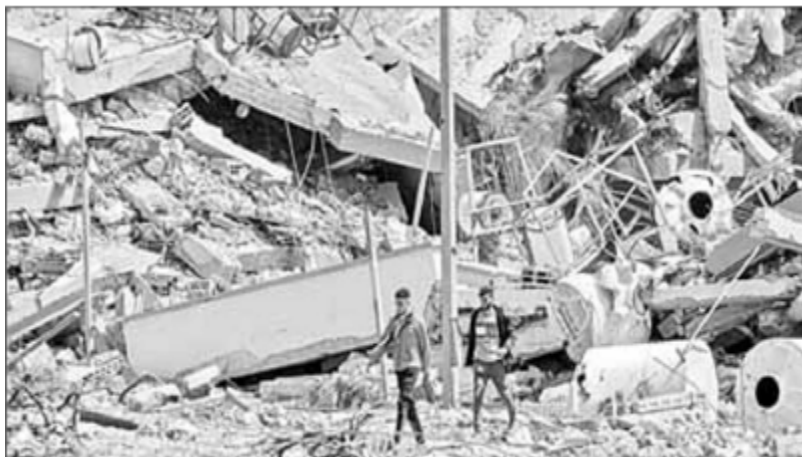
▲ Entre los edificios destruidos en el noroeste de la franja de Gaza, la gente busca algo que les pueda ser de utilidad, sobre todo ante la falta de comida y agua.