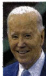
MICHAEL BRYNDLIK / EFE

:::: El Aeropuerto Internacional de la Ciudad de México (AICM) cada día se deteriora más por falta de recursos, mientras el Aeropuerto Internacional Felipe Ángeles (AIFA) no logra afianzarse como se