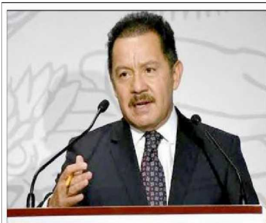
Diputado Ignacio Mier. Igualdad de género en candidaturas