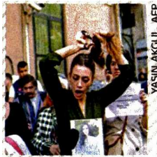
YASIN AKGUL, AFP