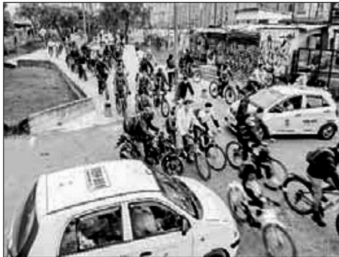
▲ Aunque en la capital colombiana es obligatorio el registro de las bicicletas, eso no ha disminuido los constantes robos de este medio de transporte.