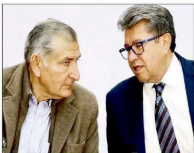
Ricardo Monreal, junto al secretario de Gobernación, Adán Augusto. Aliados de coyuntura

dadano, Clemente Castañeda Hoeflich , el senador Armenta Mier explicó que recibió el documento, pero aclaró que aún "no se le ha dado trámite" en la Mesa Directiva. Mientras tanto, en una cafetería de Reforma, frente al Senado, el secretario de Gobernación, Adán Augusto López , sostuvo reuniones con senadores para definir qué decisión se tomará ante la exigencia de la oposición de que no se retire y se votará el pasado miércoles.