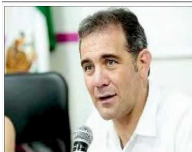
Lorenzo Córdova. El INE, ¿con asfixia presupuestal?