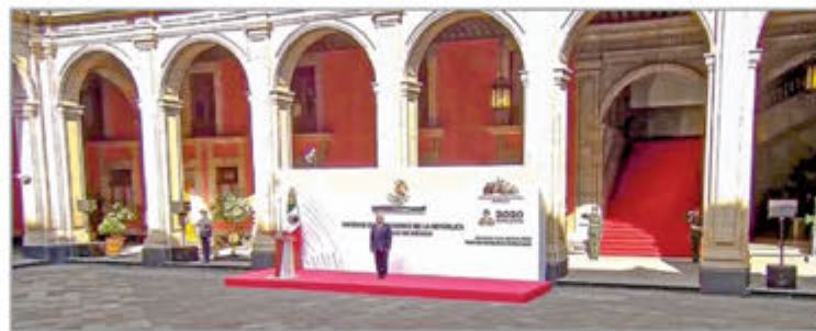
SIN GABINETE. Sólo Andrés Manuel...

En su mensaje el Presidente sostuvo que para enfrentar esta emergencia nada lo hará regresar al pasado: "ya rompimos el molde que se usaba para aplicar las llamadas medidas contracíclicas, que sólo profundizaban más la desigualdad". Adelantó que esta semana anunciará un programa de inversión pública, privada y social para el sector energético por 339 mil mdp. Advirtió que utilizará los Fondos de Estabilización y Fideicomisos para garantizar Dos Bocas, Santa Lucía y sus programas sociales MÉXICO Y NEGOCIOS P. 3 Y 14