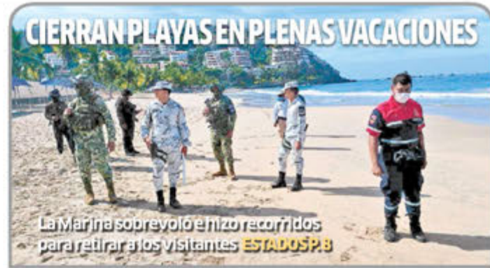
La Marina sobrevoló enizo recorridos para retirar a los visitantes ESTADOS P. 8