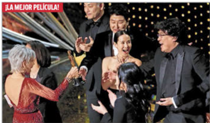
Parásitos hace historia en los Oscar VIDA+ P. 23