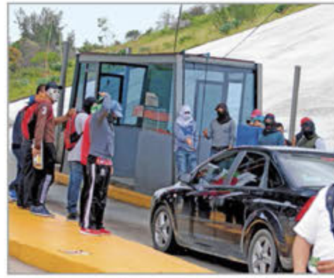
CON EPN. En el sexenio anterior las pérdidas en casetas no dejaron de subir.