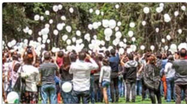
RINDEN HOMENAJE A NIÑOS DEL COLEGIO RÉBSAMEN

◆ En el Estado de México reanudarán clases mil 779 planteles, así como en otras entidades. Tanto el titular de la SEP, Aurelio Nuño, como el jefe de Gobierno, Miguel Ángel Mancera, advirtieron que los colegios sin peritaje no podrán recibir a alumnos ni obligar a nadie a tomar y dar clases P. 3-9