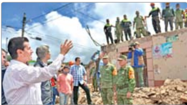
RECORRE EPN ZONA DAÑADA DEL EDOMEX CONTINÚA VISITANDO ZONAS DE DESASTRE