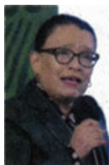
Rosa Icela Rodríguez

::::: Nos cuentan que durante la gira de ayer del presidente López Obrador por San Luis Potosí, para inaugurar la carretera Ciudad Valles-Tama-