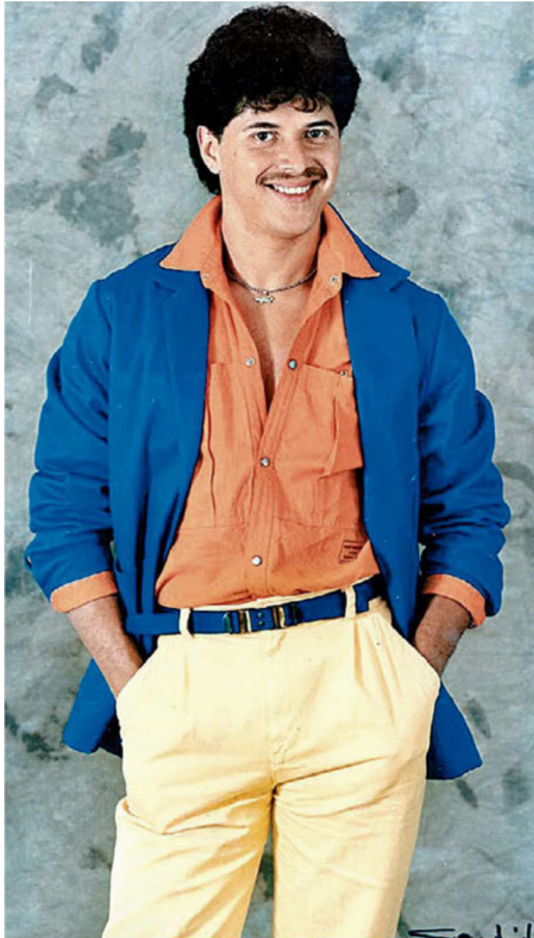
Se define como una persona que sabía hacer amigos. ESPECIAL