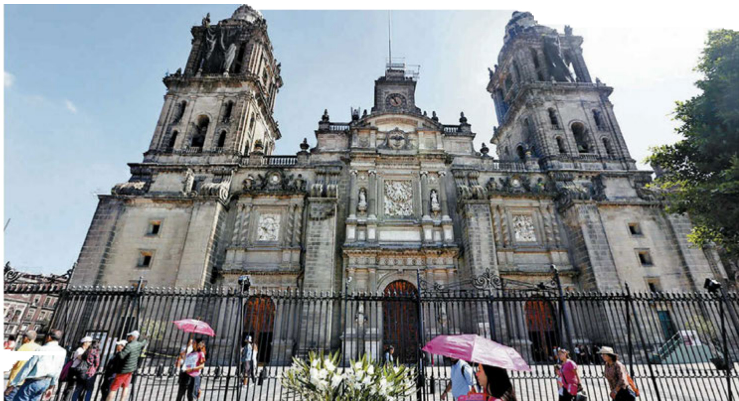
El templo católico que ha sido la coordenada preferida de la pitonisa. OCTAVIO HOYOS