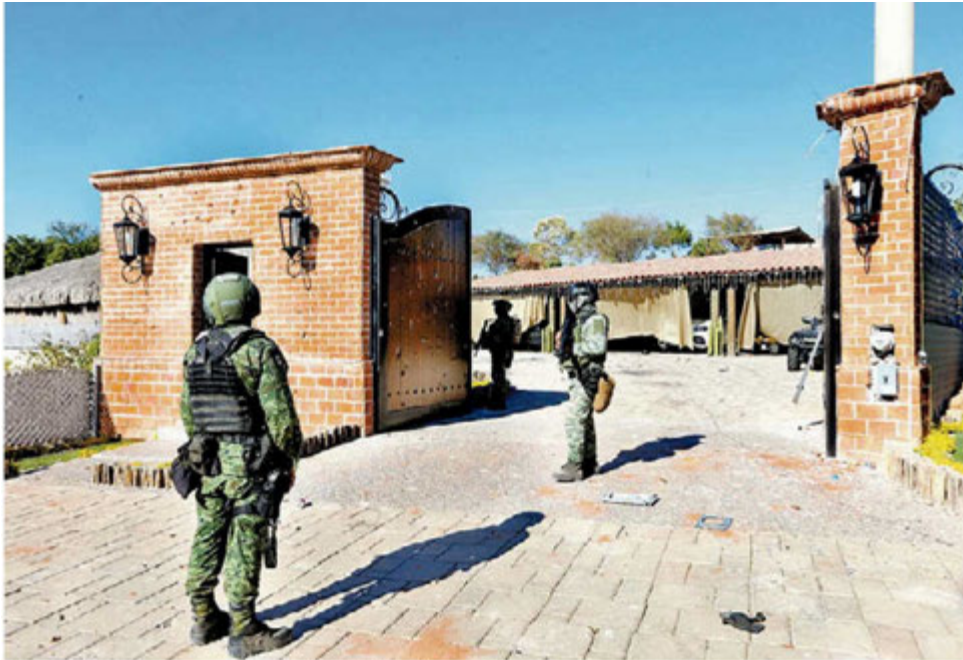
Lugar donde fue capturado Ovidio Guzmán en enero de 2023. JORGE CARBALLO