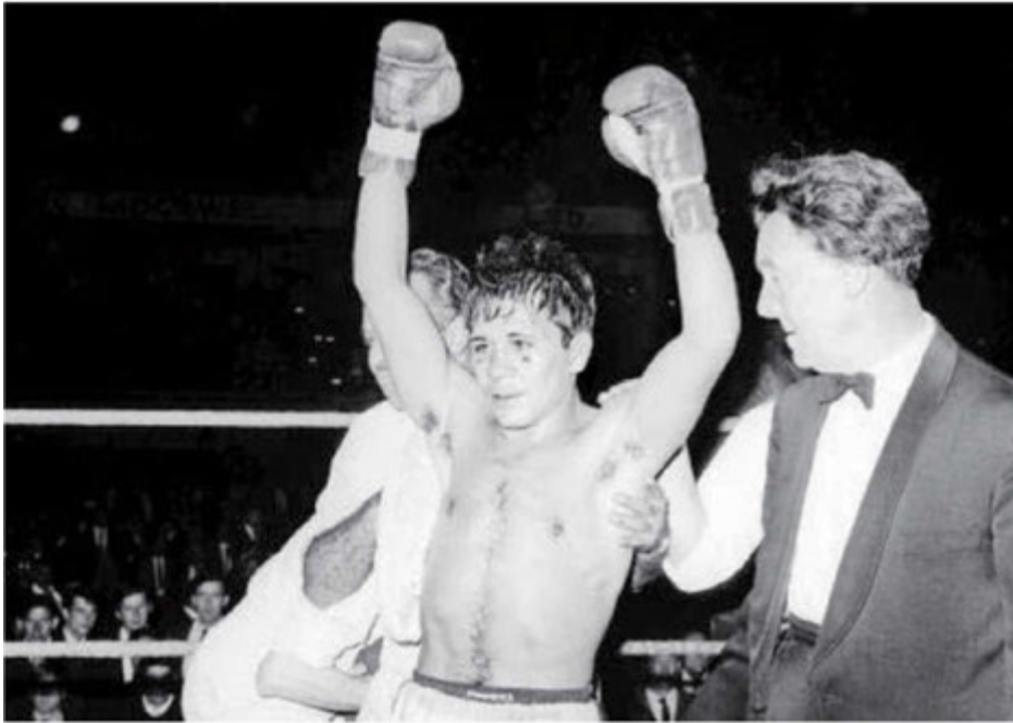
Vicente Saldivar celebra una de sus victorias obtenida por puntos