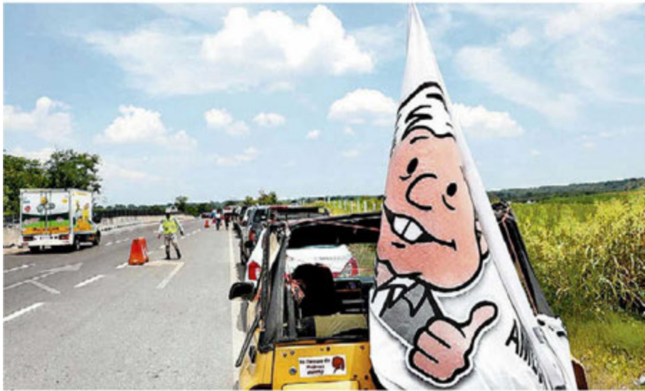
Seguramente dejará, para bien y para mal, un referente histórico. O. HOYOS