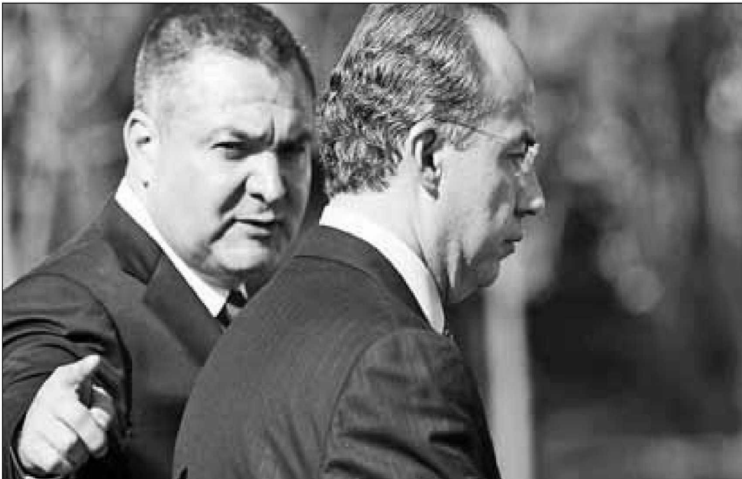
Imagen tomada en 2009 del entonces secretario de Seguridad Pública, Genaro García

Luna en compañía de Felipe Calderón.