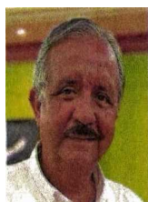
Jesús Estrada Ferreiro

:::: El que “anda centaveando” los recursos de su campaña en Sinaloa, nos comparten, es el exalcalde de Culiacán y ahora candidato del PT al Senado, Jesús Estrada Ferreiro , pues se queja amargamente de que no le alcanzan los recursos para regalar entre sus simpatizantes gorras, playeras u otros souvenirs y, a duras penas, sólo cuenta con prendas para su equipo. Sin embargo, nos indican, don Jesús le apuesta a sólo regalar muñecos de peluche con su figura a los que ha denominado los Ferreilitos y, según dice, los espectaculares en los que llega a aparecer son cubiertos por la dirigencia nacional de su nuevo partido, aunque varios se preguntan si don Jesús ¿extrañará las épocas de gastar a manos llenas?