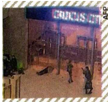
Hombres armados en el Crocus City Hall.