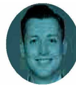
LUIS DONALDO COLOSIO RIOJAS