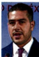
Omar García Harfuch

:::: Una gran indignación causó el asesinato de un perrito llamado Zeus , que defendió a su dueño de cuatro sujetos que, se informó, intentaban asaltar al adulto mayor. Nos detallan que la policía capitalina anda tras el rastro de los sujetos que aparecen en el video que se viralizó porque, al parecer, son presuntos narcomenudistas de la zona de la Ronda en Peralvillo, en la alcaldía Cuauhtémoc, e, incluso, se indaga si tienen nexos con la célula criminal de la Ronda 88. Y es que el propio jefe de la policía capitalina, Omar García Harfuch , indicó que el asesino, ya detenido, intentó esconderse en la colonia exHipódromo de Peralvillo.