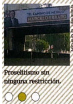
Proselitismo sin ninguna restricción.

En su afán de que sus seres queridos desaparecidos no sean olvidados, colectivos de búsqueda tratan de mantener viva la esperanza y recordar a las autoridades de quienes no han sido localizados. En este tenor, el colectivo Familia Unidas por la Verdad y la Justicia plasmó el rostro de varias personas desaparecidas en murales del Parque Borunc de Ciudad Juárez, Chihuahua y buscan más espacios para difundir su mensaje.