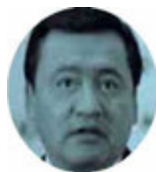
MIGUEL OSORIO CHONG

› Como plan piloto se está tomando la campaña para credencializar a un millón de simpatizantes de la 4T en la CDMX, anunciada por el dirigente nacional de Morena, Mario Delgado , y el líder local, Sebastián Ramírez . Incluso, morenistas de varios estados están pidiendo echar a andar esa misma estrategia en sus entidades.