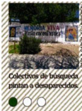
Colectivos de búsqueda pintan a desaparecidos.