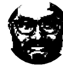
Víctor Hugo Romo

En la alcaldía Miguel Hidalgo pusieron en marcha diversas acciones para hacer frente a la delincuencia. El alcalde, Víctor Romo, busca reducir los índices de inseguridad como una de sus primeras acciones de gobierno. El concejal panista Raúl Paredes se sumó a la iniciativa, lo que deja ver que se perfila una alcaldía donde concejales y alcalde trabajarán de la mano sin distingo de colores.