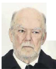
Juan Luis González Alcántara Carrancá

La llegada de un nuevo ministro, nos hacen notar, en nada conmovió a quienes serán sus compañeros en la Suprema Corte de Justicia de la Nación. Ni se inmutaron ni volvieron de sus vacaciones, y los pocos integrantes que tienen Twitter tampoco mencionaron la elección de Juan Luis González Alcántara Carrancá , al menos en la arena pública. En términos generales, el nuevo integrante recibió una fría recepción de sus futuros compañeros.