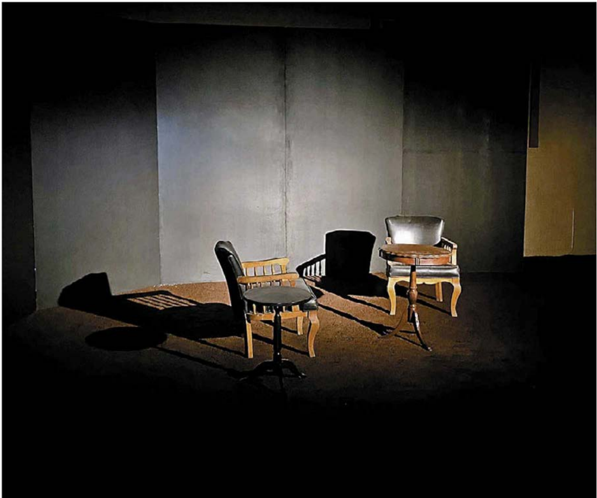
Y cuando finalmente volvieron las clases, De Tavira encontró al Teatro. D.E. OSORNO