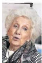
Estela de Carlotto

:::: El presidente Andrés Manuel López Obrador recibió ayer con manteles largos en su mañanera a Estela de Carlotto , fundadora de Abuelas de Plaza de Mayo, organización dedicada a identificar y recuperar personas desaparecidas por la dictadura militar Argentina. Nos cuentan que colectivos de madres buscadoras en México que nunca han sido