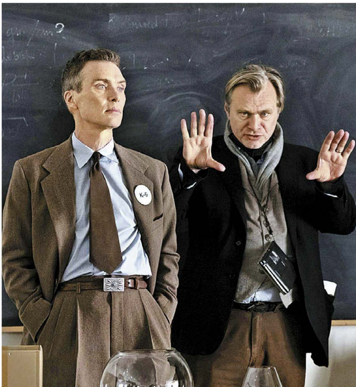
Esta semana la película se estrenó a escala mundial.