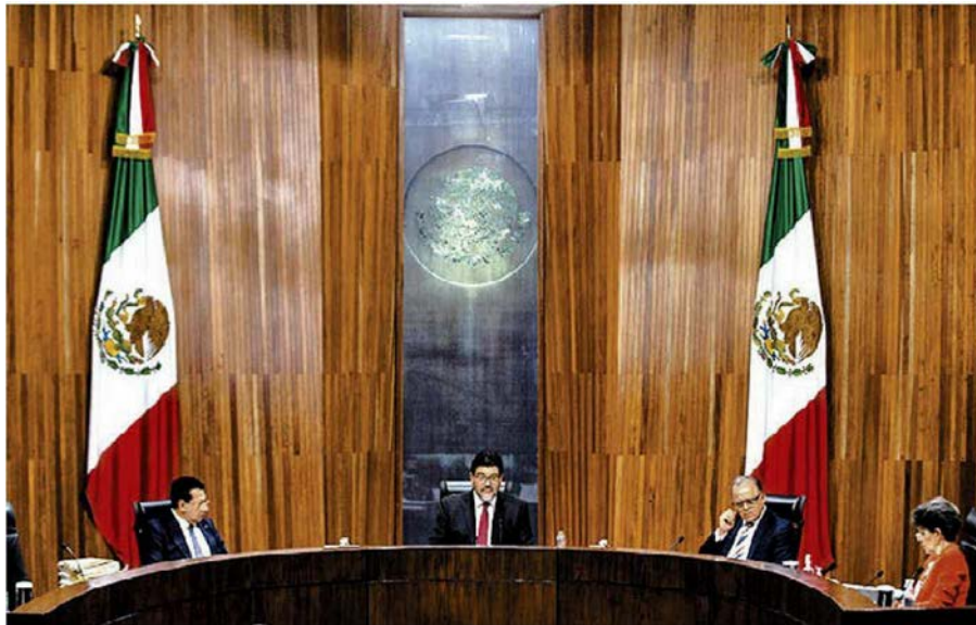
Resulta ejemplar el valor de la magistrada Janine Otálora. OCTAVIO HOYOS