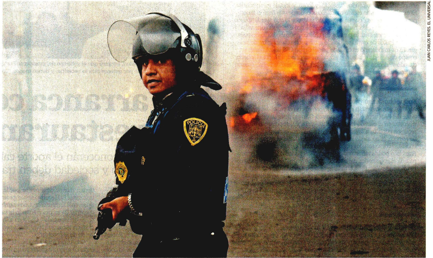
Policías de la Secretaría de Seguridad Pública capitalina apoyaron en el operativo. Al fondo, un vehículo de transporte público que fue quemado en respuesta.