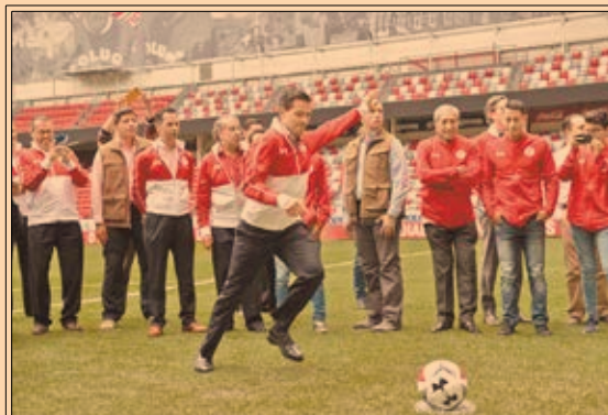
Anotando un penal, Peña Nieto celebra cumpleaños e inaugura nuevo estadio del Toluca. P44