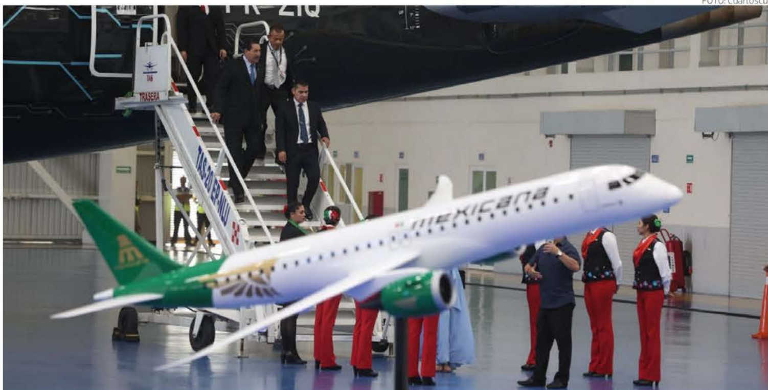
Con bombo y platillos Mexicana de Aviación, la aerolínea del Estado mexicano, presentó este viernes su nueva aeronave de fabricación brasileña Embraer E195 E2, con capacidad para 132 pasajeros y que se suma a la flotilla que ya ofrece servicio a 18 destinos del país. PAG. 7