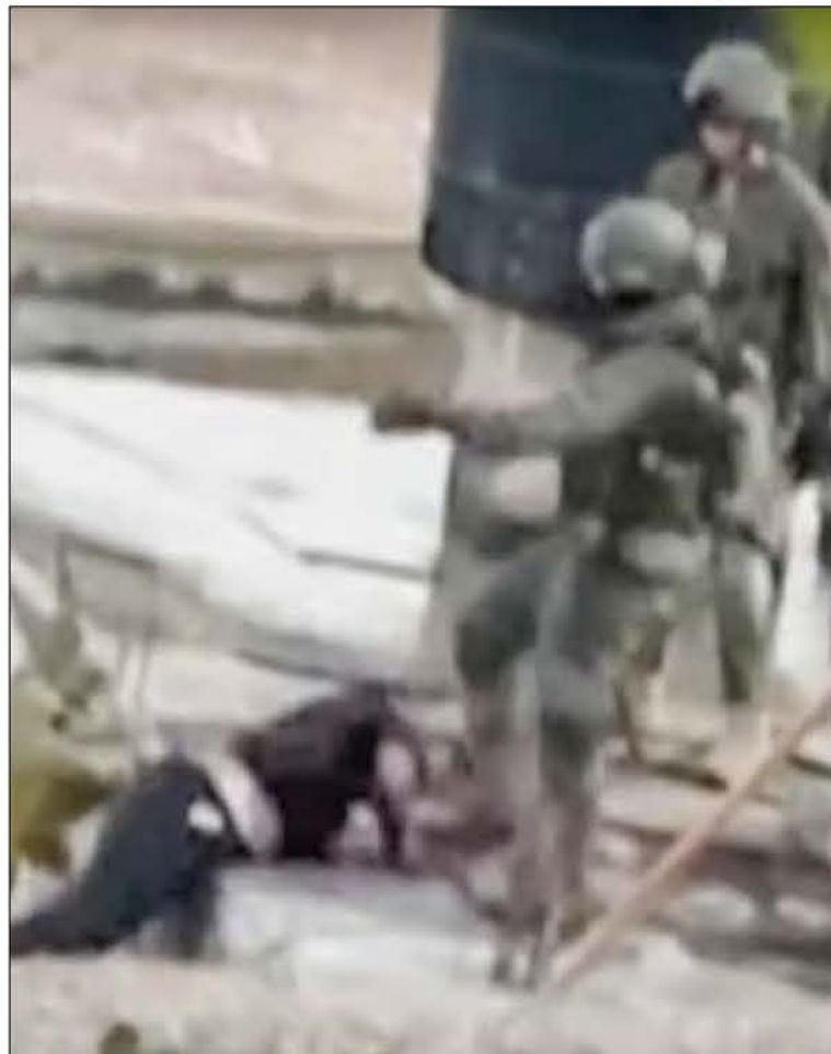
Qabatiya. Este proceder contraviene la Convención de Ginebra. Tel Aviv sostuvo que investiga a los militares implicados en esta acción. La Casa Blanca describió las imágenes como "profundamente inquietantes" y aseguró que exigió una explicación a Israel.

● La ONU califica el acto de violación al derecho internacional humanitario