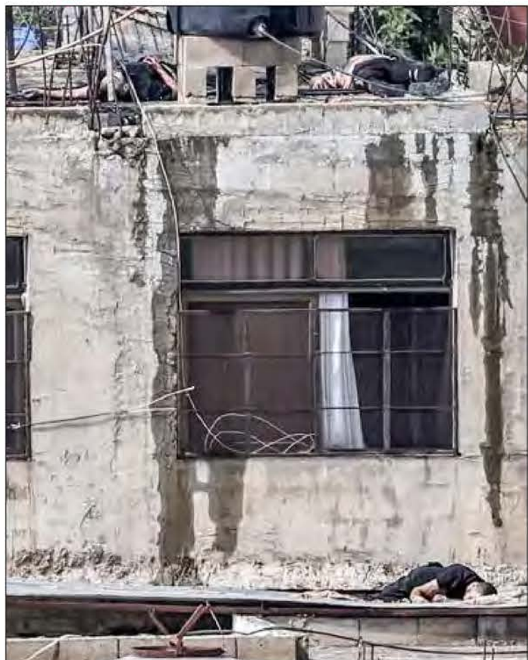
▲ Militares israelíes empujaron el jueves cuatro cuerpos, aparentemente sin vida, desde el techo de un edificio durante una redada en la Cisjordania reocupada, de acuerdo con periodistas y videos. "La excavadora se los llevó sin dejar que nos despidiéramos de ellos ni hacerles un funeral", relató un residente de la ciudad de