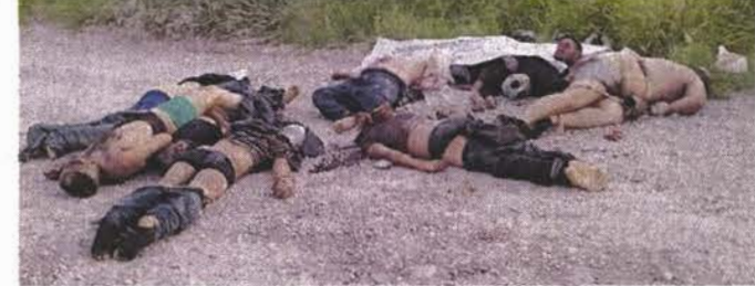
Once cuerpos fueron abandonados ayer en Ojinaga.

Hace 12 días comenzó un periodo de violencia en Sinaloa, una "guerra" que ha dejado 61 asesinatos en esa entidad, es decir, en promedio se han registrado 5 asesinatos por día.