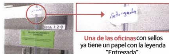
Una de las oficinas con sellos ya tiene un papel con la leyenda "Entregada".

Acuerdan que sólo quienes presiden o sean secretarios de una Comisión podrán tener asesor parlamentario; al resto le reducen de 4 a 2 el número de asistentes