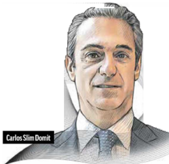
Carlos Slim Domit