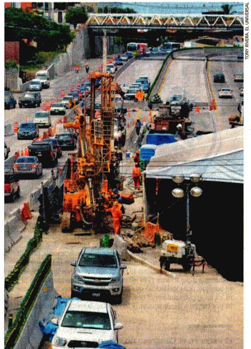
La SCT informó que el dictamen final del peritaje estará listo en 15 días.