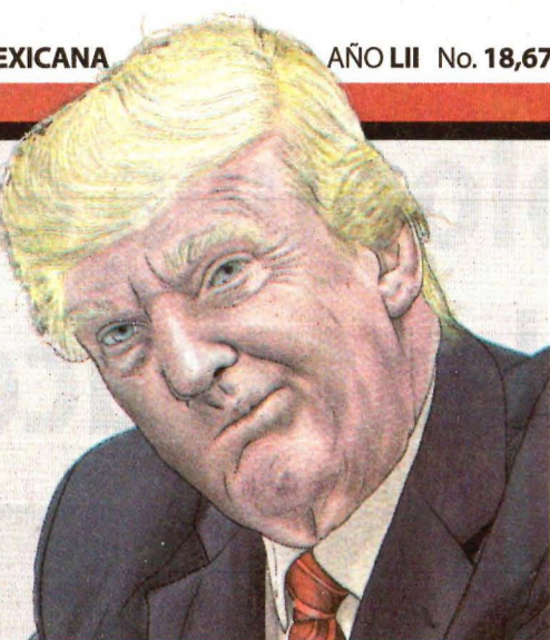
ILUSTRACIÓN: ELIHU GALAVIZ Y VICTOR NIETO