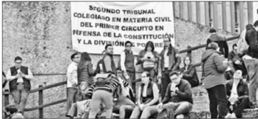
▲ Trabajadores del Poder Judicial de la Federación suspendieron labores de manera