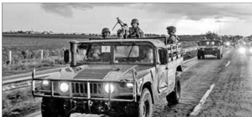
▲ Un convoy de soldados del Ejército Mexicano, a bordo de vehículos militares, patrullan una carretera de Culiacán, como

parte de un operativo para reforzar la seguridad tras una ola de violencia en los días recientes.