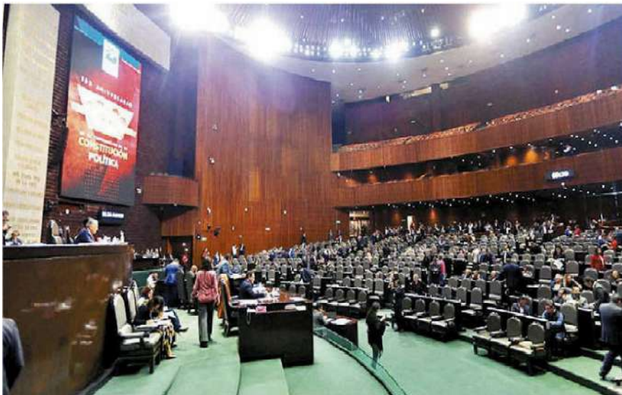
Palacio Legislativo de San Lázaro. JORGE CARBALLO