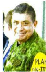
Luis Cresencio Sandoval

::::: Vaya sorpresa, nos aseguran, se llevaron los militares al ver a tres civiles con chalecos del partido Morena al interior de la Secretaría de la Defensa Nacional (Sedena), una dependencia que es apolítica. Cargados