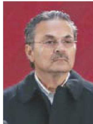
Octavio Romero Oropeza