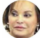
Elba Esther Gordillo