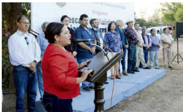
TOMADA DE TWITTER