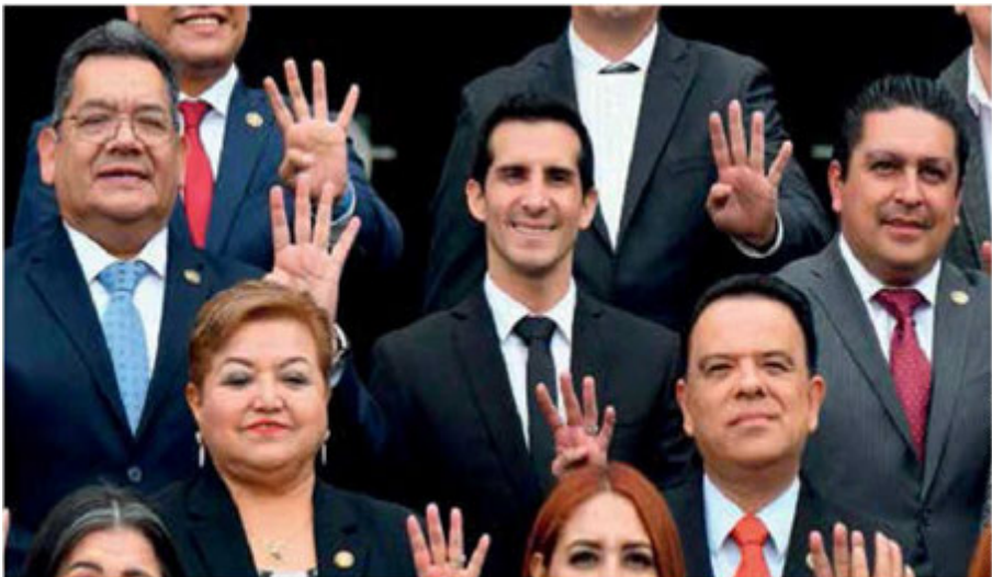
El candidato morenista Rommel Pacheco asegura que no recibe remuneraciones por actividades empresariales.