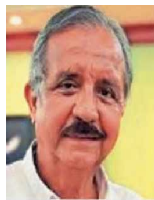
Jesús Estrada Ferreiro

::::: Nos comparten que en Sinaloa el exalcalde de Culiacán y ahora candidato del PT al Senado, Jesús Estrada Ferreiro (Morena), prefirió bajarle dos rayitas a su discurso beligerante y llevar la fiesta en paz. Nos relatan que don Jesús empezó su campaña despotricando a diestra y siniestra, pues tildó a los diputados locales de ser "una pandilla delictiva" y al gobierno estatal de emprender una persecución política en su contra, pero al parecer en su cuartel vieron que era mala estrategia y ahora don Jesús pregona que "a él no lo mueve ni el rencor ni la venganza", y que si conquista el escaño extenderá la mano en temas torales, como la agricultura, la ganadería y la pesca. ¿Será estrategia o miedo?