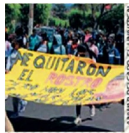
Normalistas seguirán manifestándose.

Con ello, la mexicana estará en las pruebas de la especialidad en los próximos Juegos Olímpicos de París 2024. Cabe recordar que Reinoso ya cuenta con experiencia olímpica luego de participar en Tokio, 2020. ●