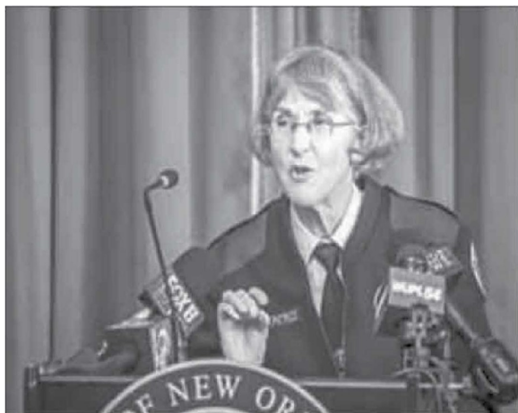
▲ “Las ratas están muy drogadas”, fue una de las frases que la jefa de la policía de Nueva Orleans pronunció ante el concejo municipal para detallar la situación del viejo edificio.

MIENTRAS TANTO, LOS roedores seguirán de fiesta mientras no terminen con la evidencia de varios casos judiciales.