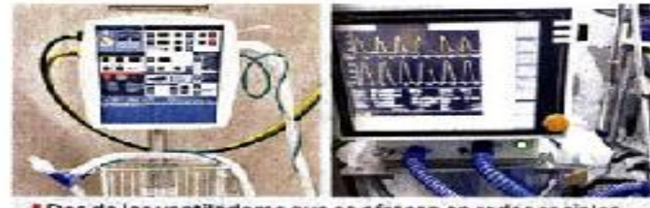
Dos de los ventiladores que se ofrecen en redes sociales.