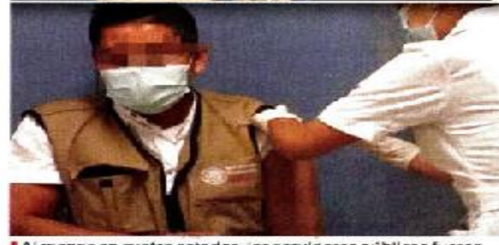
Al menos en cuatro estados, los servidores públicos fueron captados recibiendo la vacuna contra el Covid-19.