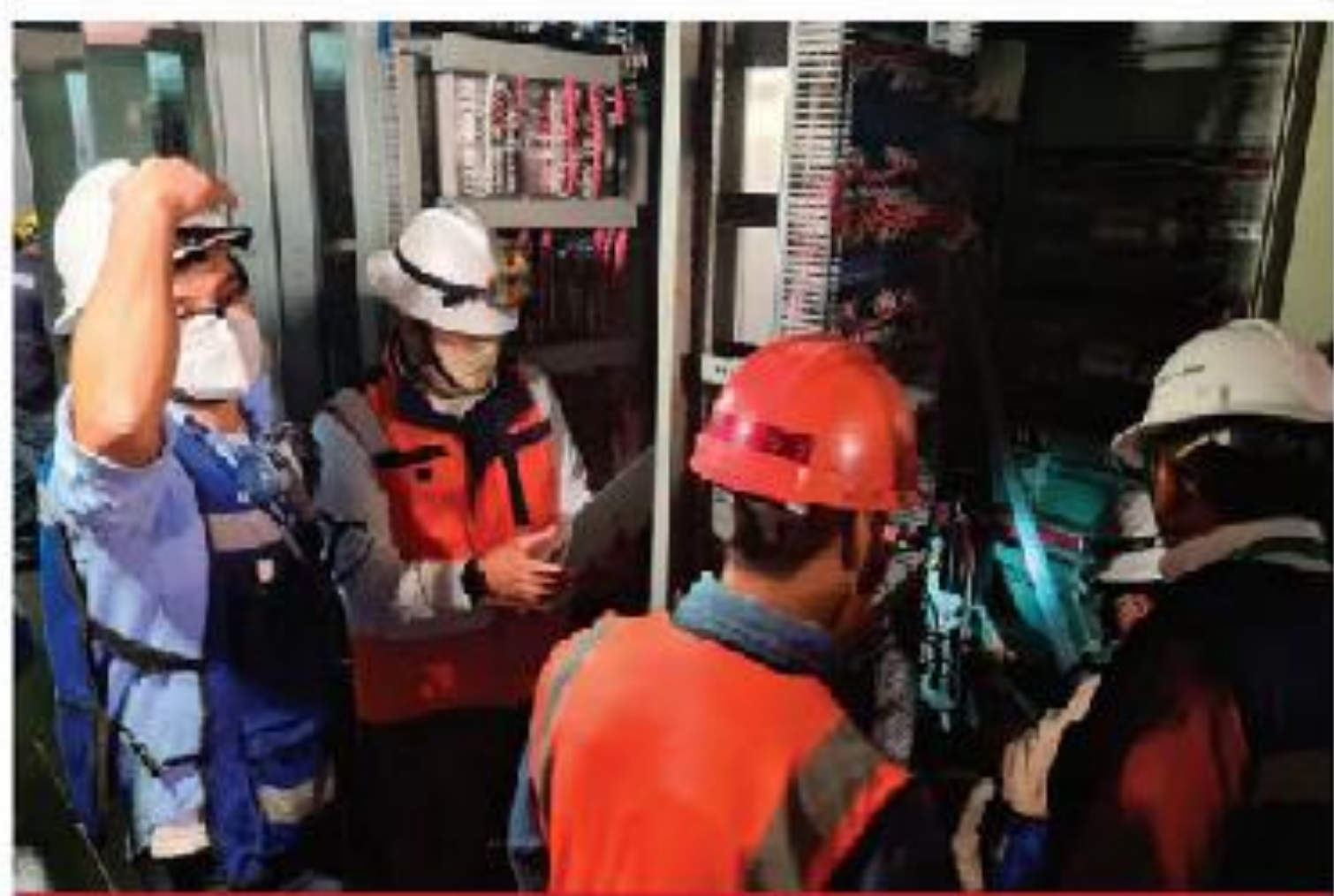
Técnicos del Sistema de Transporte Colectivo trabajan en el puesto central de control de energía en conjunto para las Líneas 1, 2 y 3 que ya registra un avance del 90 por ciento.

La apertura unilateral del expediente Cienfuegos que hizo México violentó cláusulas de los acuerdos bilaterales en la materia, señala el Departamento de Justicia [ Agencias en Washington ] 3