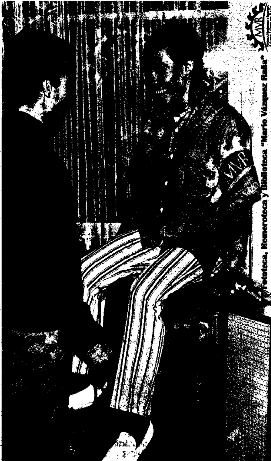
Rubén "El Púas" Olivares, múltiple campeón mundial