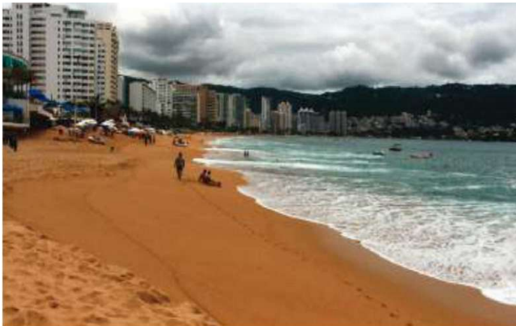
LAS PLAYAS de Acapulco, durante el verano pasado.

Guerrero, y en el propio Puerto, den la certeza necesaria para su óptima operatividad, porque las circunstancias que estamos viviendo no dan margen para errores, y mucho menos para “secuestros” de ningún tipo.