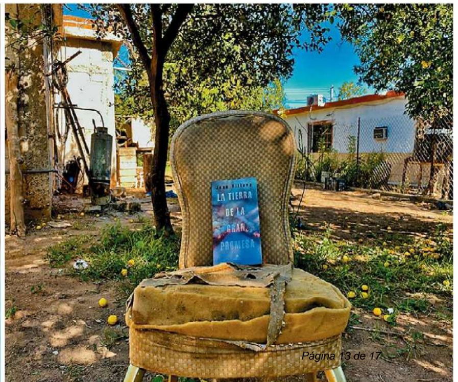
Página 13 de 17