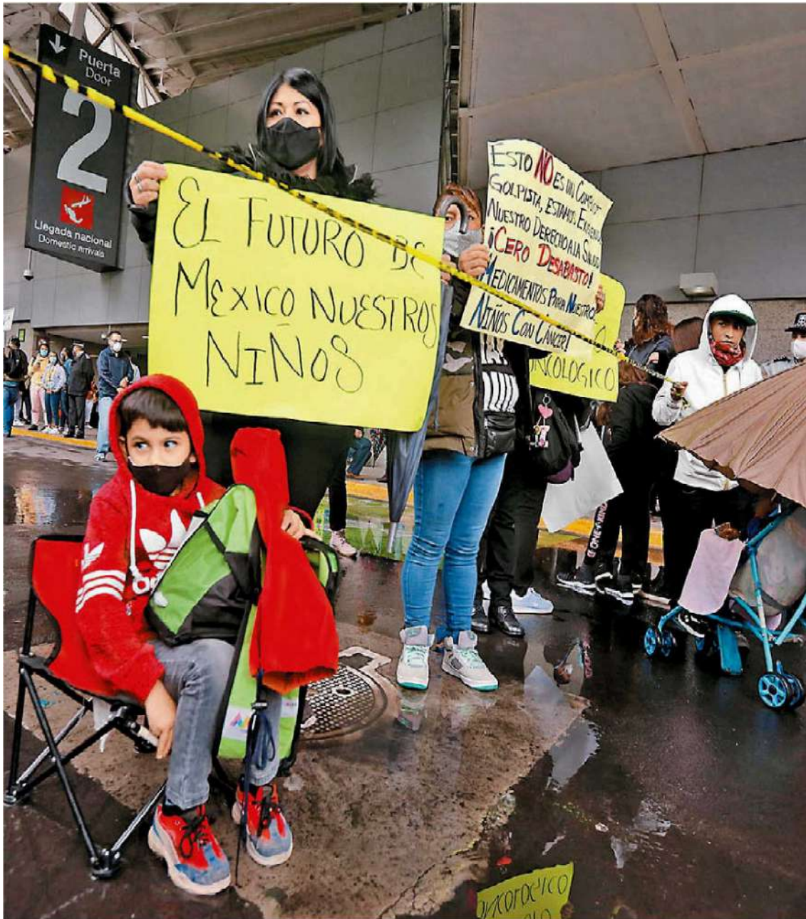
Las críticas del Poder Legislativo se centraron en el desabasto de tratamiento oncológico. JAVIERRÍOS