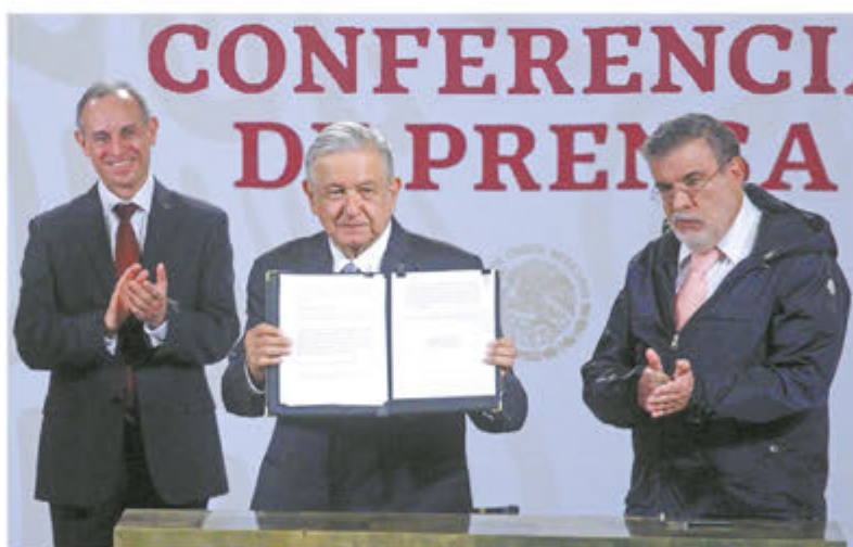
El Presidente muestra el documento de la solicitud de consulta.

Anoche, el Senado recibió 2.5 millones de firmas para iniciar el proceso por la vía ciudadana. | NACIÓN | A6 Y A7