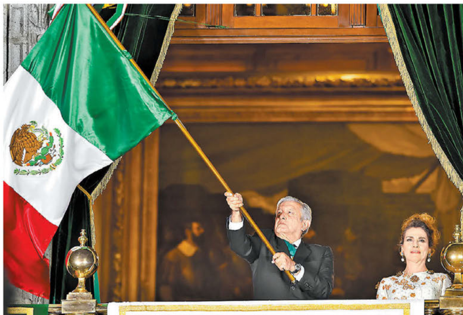
Andrés Manuel López Obrador y su esposa, Beatriz Gutiérrez Müller, durante la conmemoración. ESPECIAL