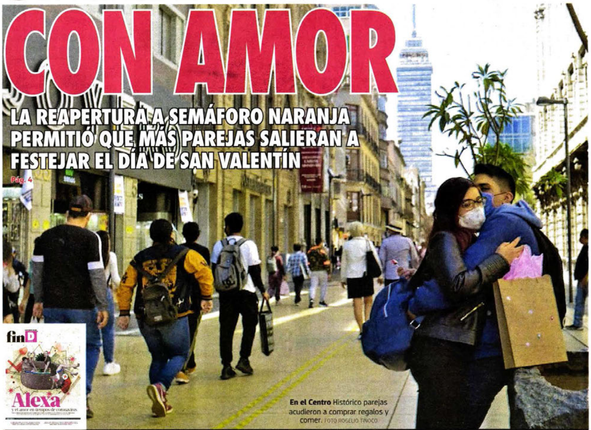
En el Centro Histórico parejas acudieron a comprar regalos y comer.