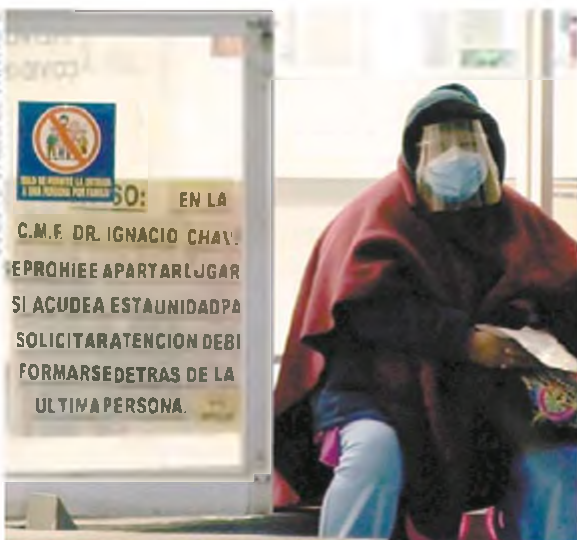
Para sobrellevar la espera y el frío, algunas personas llevan consigo sillas, bancos y cobijas.

CONSEJOS PARA SOBRELLEVAR LA ESPERA Y EL FRÍO, ALGUNAS PERSONAS LLEVAN CONSIGO SILLAS, BANCOS Y COBITAS.