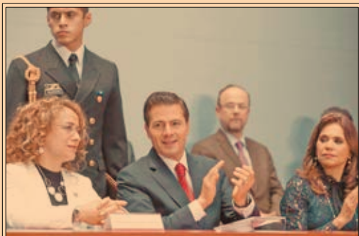
El presidente Peña Nieto, al celebrar el Día del Abogado, pidió a profesionistas del derecho un "alto compromiso con la ley". P43

Donald Trump no logra desprenderse del escándalo con Rusia que empantana su presidencia: TWP. P37