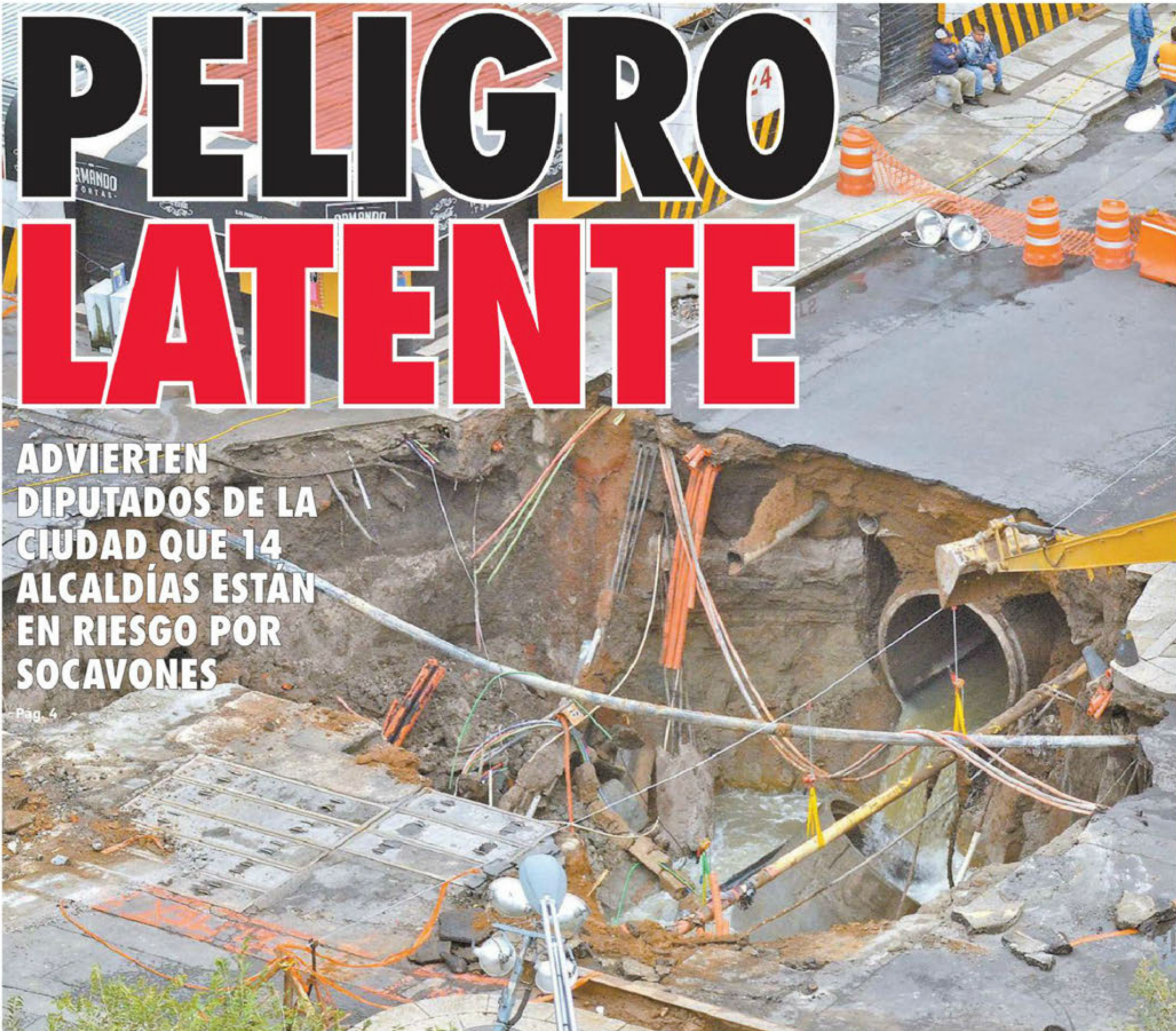
El socavón de Paseo de la Reforma de 2017 tardó un año en repararse.