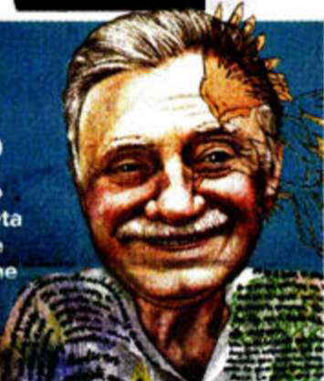
Ilustración: Jesús Sánchez