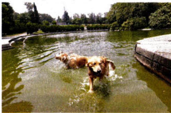
El agua se aprecia verdosa y, en ocasiones, maloliente.

se construyó una más moderna para, de caudales de drenaje, obtener líquido saneado para reinyectarlo al acuífero.