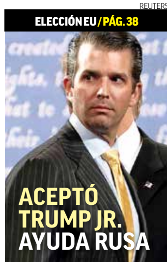
ELECCIÓN EU / PÁG. 38