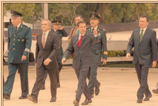
El presidente Peña Nieto urgió a la Conago a consolidar las instituciones de seguridad y justicia. P38