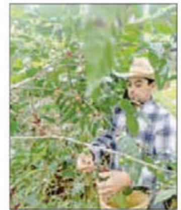
▲ Cosecha en Coatepec, Veracruz.

Reporte especial: caficultores, los que menos ganan en la cadena de riqueza del grano