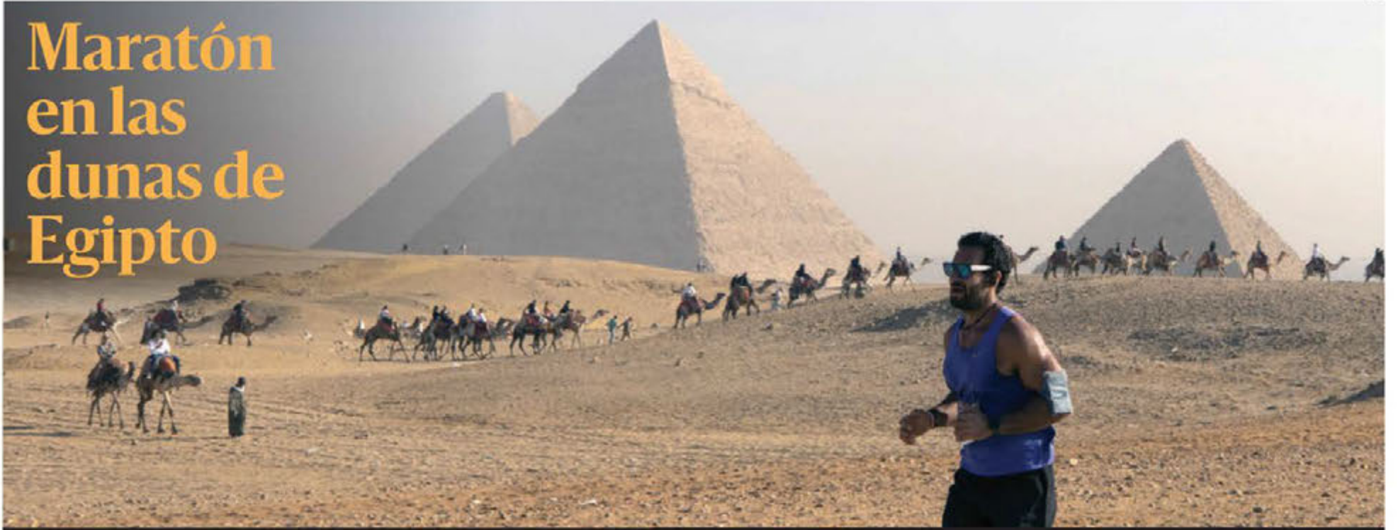
Un participante corre durante la cuarta edición de la Media Maratón de las Pirámides en la Meseta de Giza, en las afueras de El Cairo, frente a las emblemáticas construcciones y caravanas de camellos.