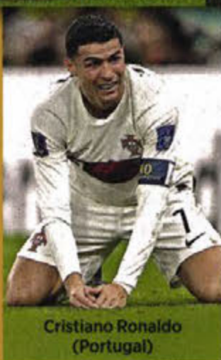
Cristiano Ronaldo (Portugal)

Marruecos venció 1-0 a Portugal y extendió su sueño mundialista a las Semifinales de Qatar 2022, donde enfrentará al campeón Francia, que ganó 2-1, en un partidazo, a Inglaterra.