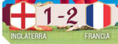
POR LUIS GARCÍA OLIVO ENVIADOS

HARRY KANE FALLO UN PENALTI Y GIROUD ECLIPSÓ A MBAPPÉ EN EL TRIUNFO GALO