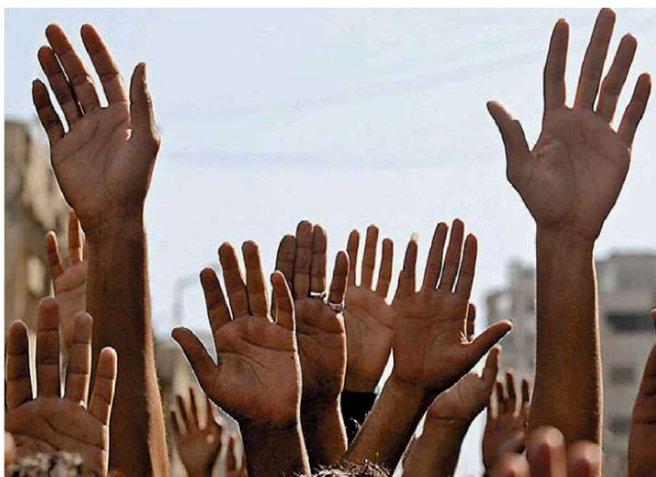
Somos legión los indecisos que no compramos ideas en paquete.