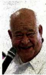
Victor Castro Cosío

:::: Nos cuentan que en Baja California Sur varios se truenan los dedos por el jaloneo del presupuesto de egresos que están por aprobarle al gobernador Victor Castro Cosío (Morena), para su primer año de gestión, ya que son pocos los recursos destinados a algunos grupos vulnerables y temas prioritarios de la autodenominada 4T. Según nos detallan, en la propuesta que el góber envió al Congreso de mayoría guinda, destinaría apenas unos 3 millones de pesos al Instituto de Personas con Discapacidad, unos 4 mdp para el Sistema Estatal Anticorrupción, y 10 millones para el Instituto de Transparencia; mientras que proyecta un gasto en difusión de 45 millones de pesos, y en un año sin elecciones, le destina al Tribunal Estatal Electoral 17 millones de pesos. ¿Ponderarán los diputados morenistas el bienestar social o le darán el visto bueno a don Víctor?