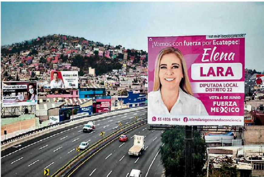
Fuerza X México, uno de los desaparecidos.

histórica que avala la decisión del INE de pérdida de registro de tres partidos que no alcanzaron 3% de los votos en junio pasado. Es la regla que existe y es inaceptable relativizar los términos de la Constitución, como se pretendía. La buena noticia es que el TEPJF entiende que el fortalecimiento de la democracia transita, necesariamente, por el rescate de la confianza en sus instituciones. ■