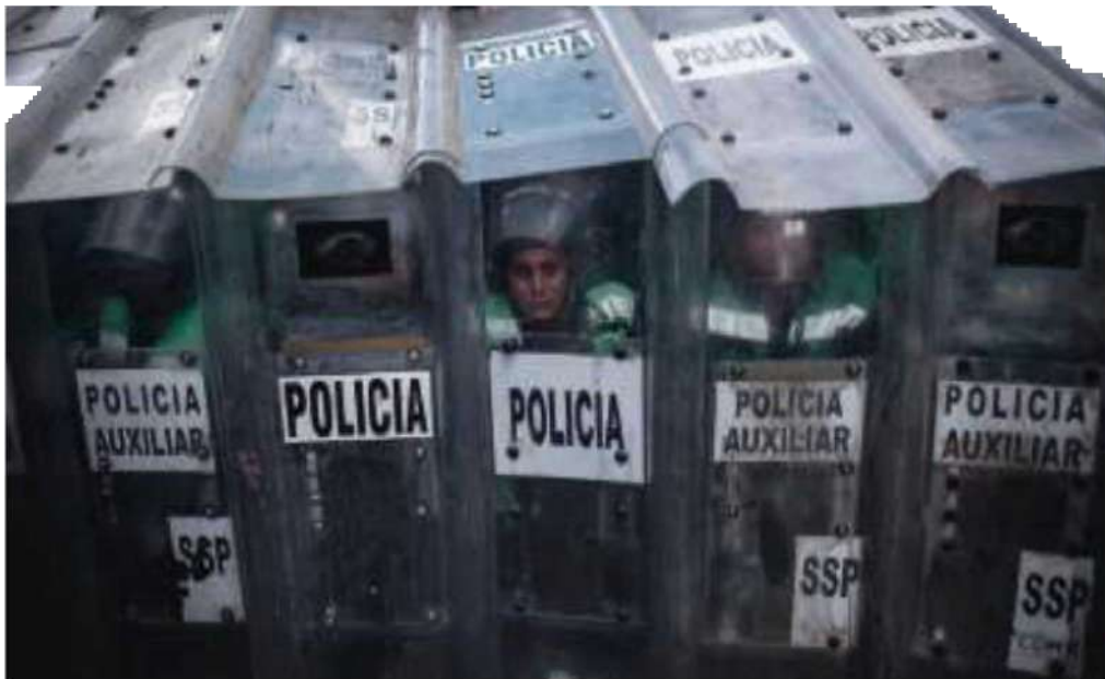
ELEMENTOS policiales en una marcha feminista de la CDMX.