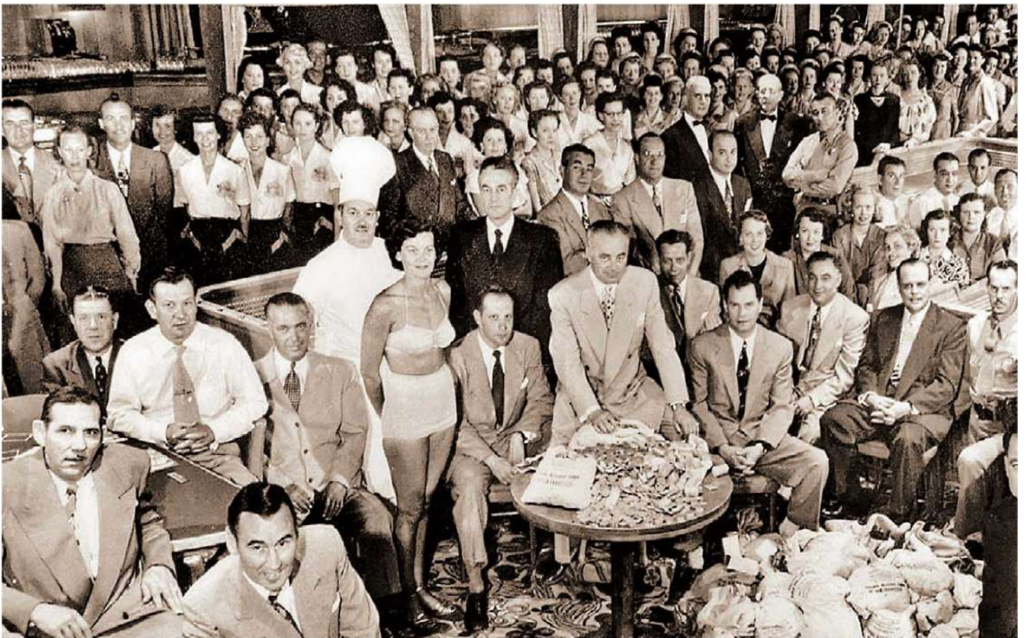
En el recinto uno puede darse idea de algunos grupos del hampa hechos famosos por Hollywood.