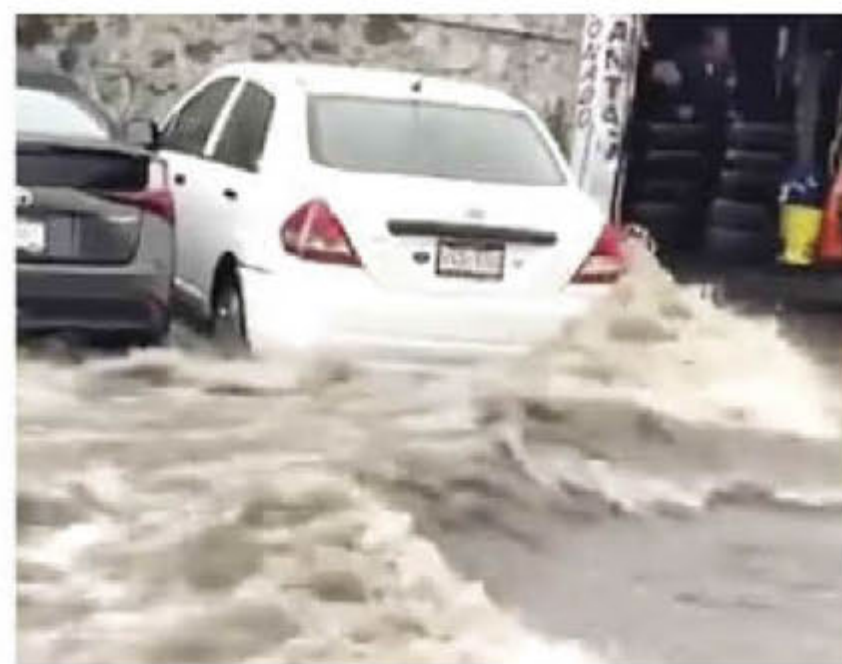
MAS LLUVIAS...MAS INUNDACIONES Tarde de aguacero en la CDMX.