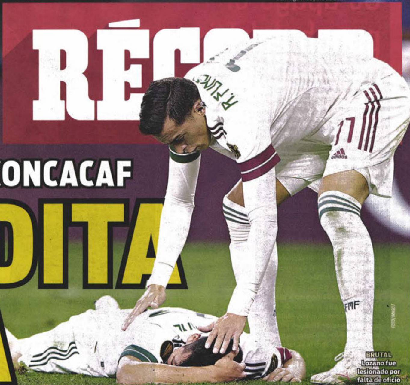
BRUTAL Lozano fue lesionado por falta de oficio trinitario.