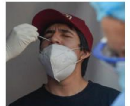
Acuden jóvenes y hasta niños.